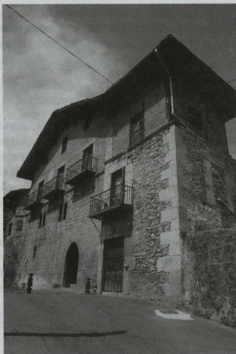
Casa Torre de Balda en Azkoitia

El 30 de junio de 1945, tomaba posesión de la plaza de Inspector Municipal Veterinario de Zarautz, que ocuparía hasta su jubilación reglamentaria el 30 de junio de 1985.