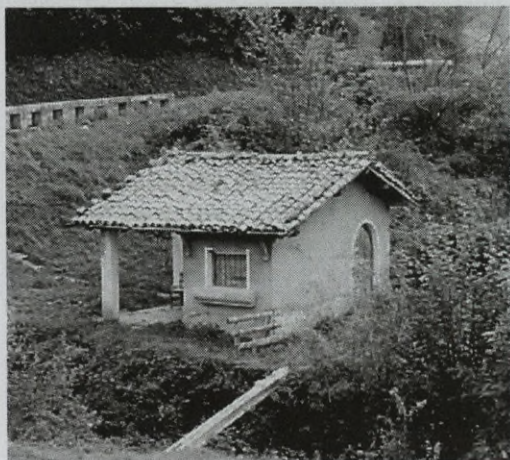
Centro Secundario de Inseminación de Berastegui.

hacia el Alto de San Antón, para construir un Centro Secundario de Inseminación; detrás de tan pomposo nombre se esconde una chabola de ladrillo donde amén de inseminar las vacas de la localidad, evitando al veterinario los traslados a los caseríos para tal menester, existía un pequeño despacho para cumplimentar las sencillas tareas burocráticas que exigía la Diputación.