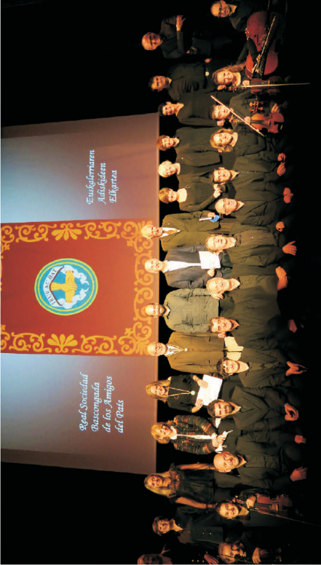
Bascongadako adiskideak, Bergarako alkatea eta Bergara Antzerki Musikala taldea