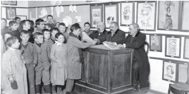
Bergarako Arte eta Lanbide Eskolako sari banaketa, 1906-1917 tartean.