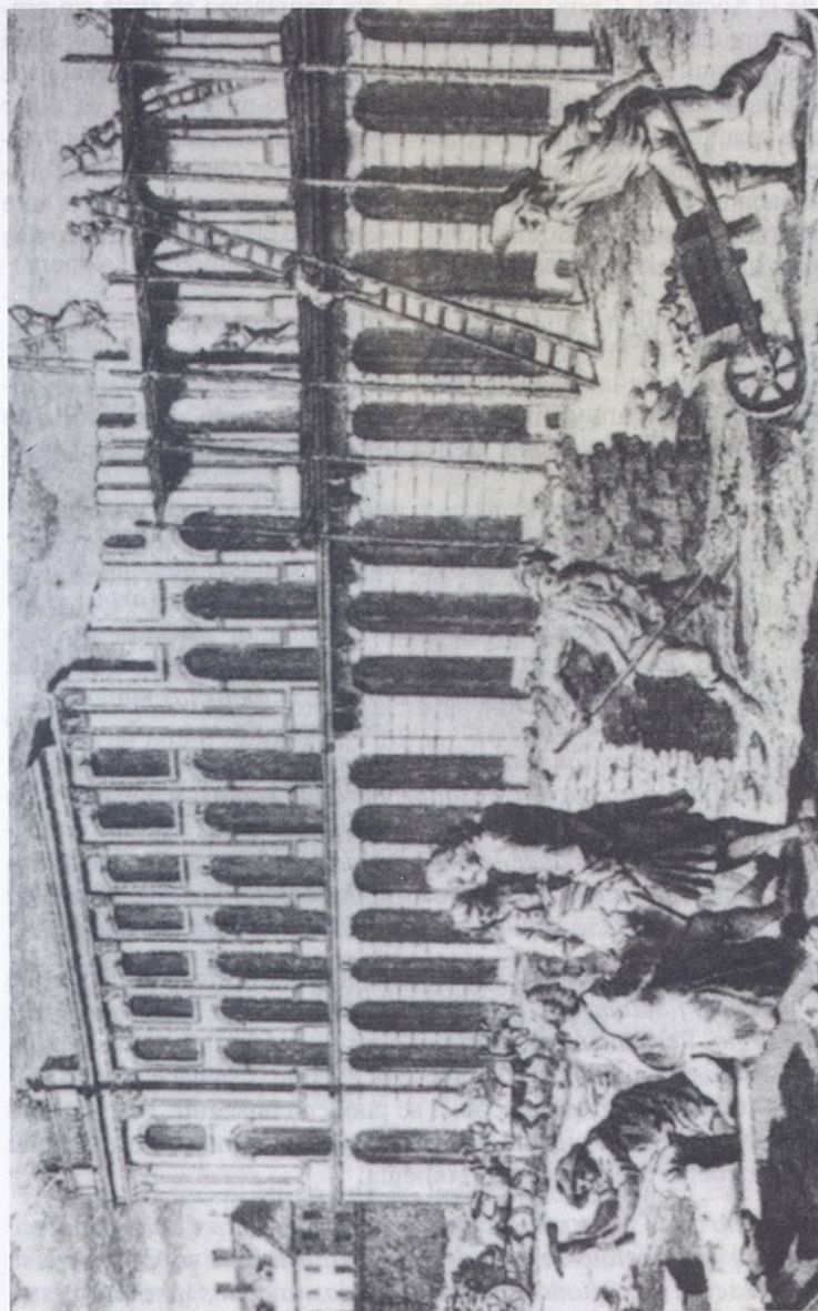
(Fig. 2). - El tratamiento profesional de la arquitectura tenía un papel diferenciado con respecto al resto de las artes, presidiéndose a esta materia especial atención en el Seminario de Vergara. Las Escuelas de Dibujo enseñaban los rudimentos de la arquitectura, para posteriormente englobar su estudio de especialización dentro del ámbito de la segunda comisión, orientada hacia el campo de las ciencias y de las artes útiles. Construcción arquitectónica dibujada por Giramet y grabada por Collin. París 1761 (Biblioteca Nacional de París. F. 38004).