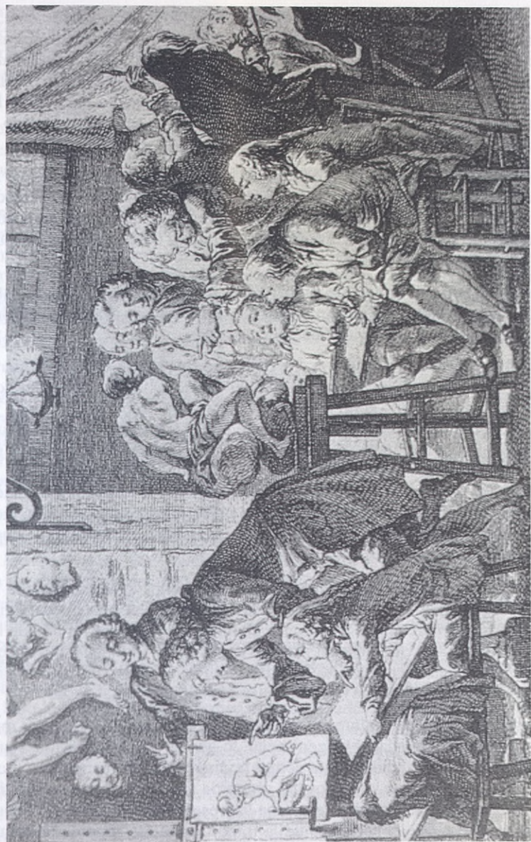
(Fig. 5). - Las clases de dibujo se impartirían después del trabajo ordinario, con objeto de no impedir a los aprendices la asistencia a sus talleres en horario laboral. La Enciclopedia... Escuela de Dibujo VI. S. Dibujado por Cochim y grabado por F. L. Prevost.