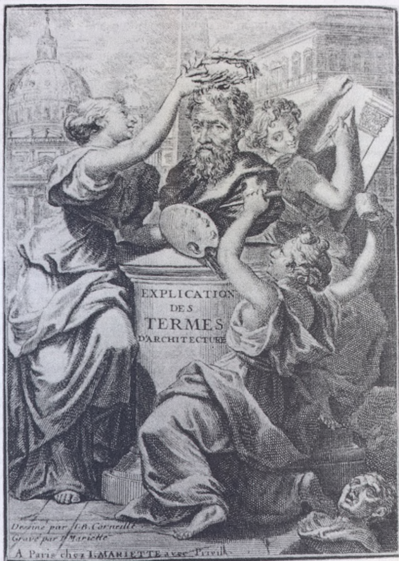
(Fig. 1). - En relación con las artes, las comisiones segunda y cuarta fueron las que se relacionaron con ellas. A la comisión segunda dedicada a las ciencias y artes útiles perteneció la arquitectura, mientras que la escultura y el dibujo estuvieron asociadas a la cuarta comisión, dedicada a la Historia, la Política y las Buenas Letras. Cotux d'architecture de C.A. D'Avalier. Frontispicio con las alegorías de la arquitectura, escultura y pintura. Estampa dibujada por I. F. Corneille y grabada por I. Mariette.