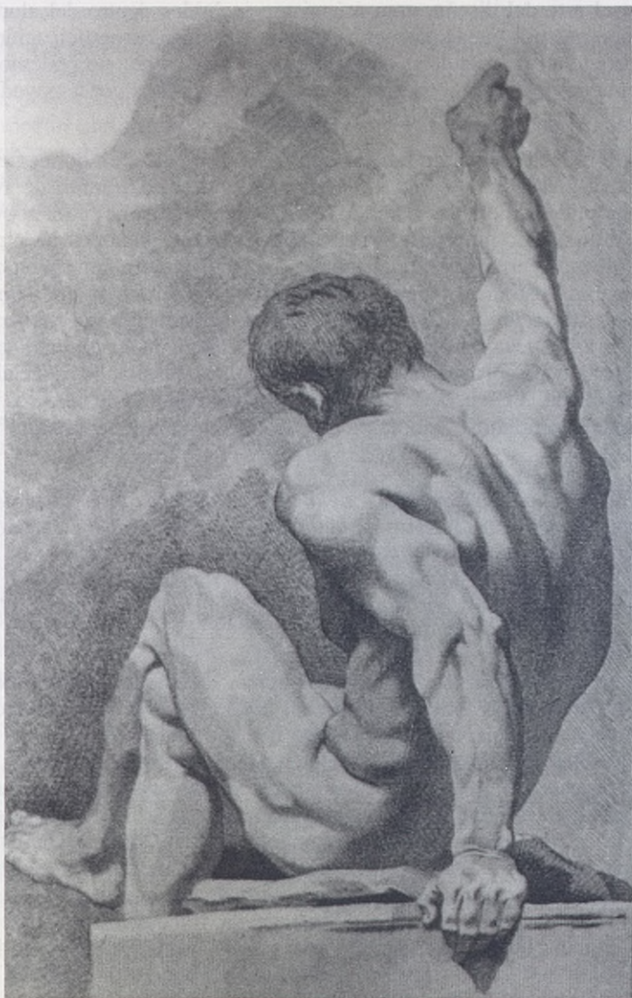
(Fig. 6). - El principiante, siguiendo los sistemas pedagógicos de la enseñanza artística del momento, comenzaba primeramente por las partes de la cabeza, narices, boca, ojos y orejas. Después continuaba con las manos, pies y piernas, para seguidamente juntar todo y pasar a las figuras desnudas en distintas posiciones. La Enciclopedia... El dibujo VI. S. Grabados de Prevost.