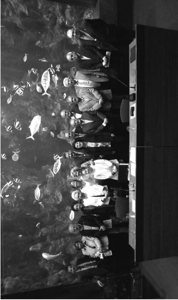
Amigos de la Bascongada