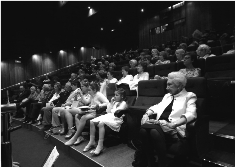
Aquarium (Donostia-San Sebastián)