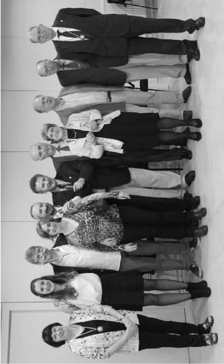
Familiares y Amigos de Número de la Bascongada