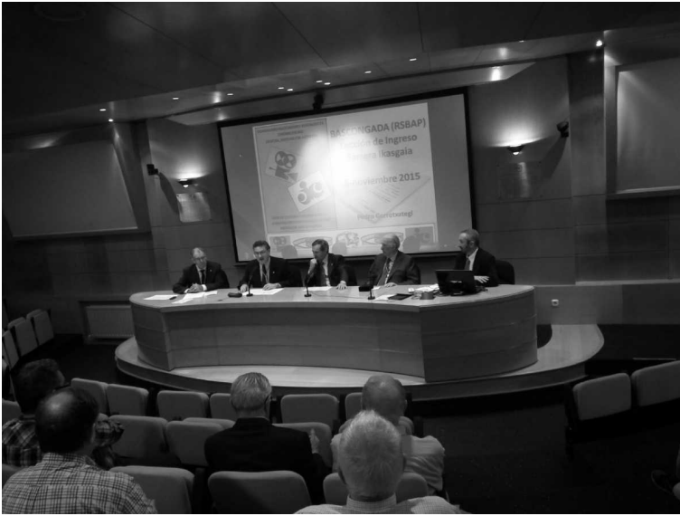
Gipuzkoako Sendagileen Elkargo Ofiziala Colegio Oficial de Médicos de Gipuzkoa SALÓN DE ACTOS. EKITALDI ARETOA