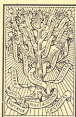
PATRONATO "JOSE MARIA QUADRADO"

Este número extraordinario ha sido costeado por el Patronato «José María Quadrado» del Consejo Superior de Investigaciones Científicas.