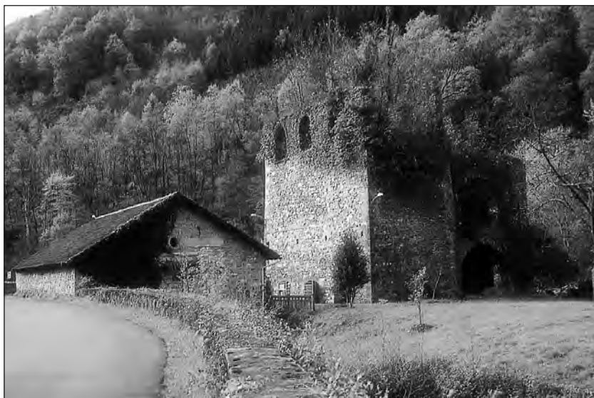
Lámina Nº 2. Vista de Fagollaga aguas arriba.