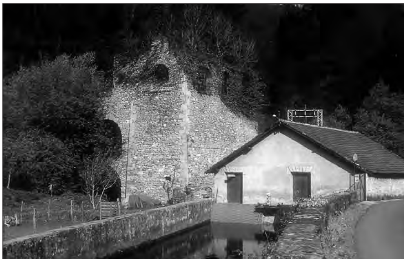
Lámina Nº 3. Vista de Fagollaga aguas abajo.