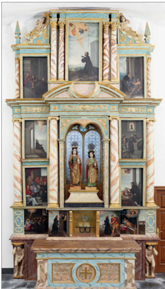
Retablo actual de la iglesia de los Mártires de Azkoitia, restaurado por José Luis Larrañaga (con el relicario de los Santos y el exvoto de unos grilletes en referencia a la liberación de un preso).