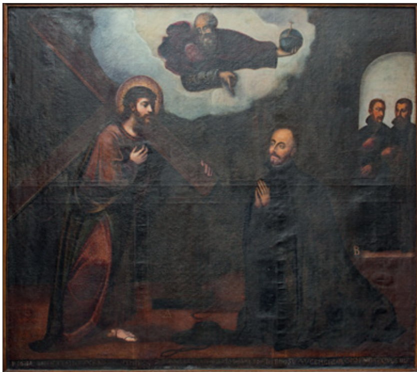
Visión de Ignacio de Loyola en la capilla de la Storta. Única obra conservada del ciclo iconográfico realizado por Bartolomé Noblet para el retablo de la iglesia del Colegio de los Jesuitas de Azkoitia (1655). Actualmente expuesta en la capilla de la Casa de Balda de Azkoitia.