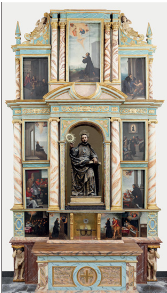
Fotocomposición de la imagen aproximada que podría tener el primer retablo dedicado al beato Ignacio de Loyola en su pueblo natal de Azpeitia (1613).