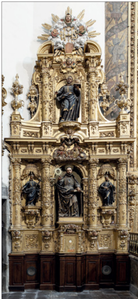
Imagen actual del retablo de San Ignacio en la parroquia de Azpeitia.