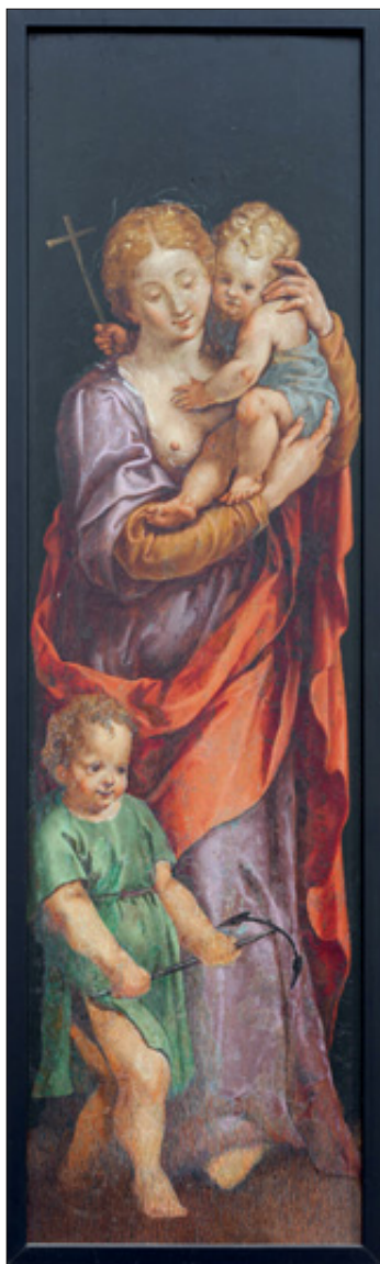
Pinturas que representan a las Virtudes, que aparecieron ocultando las figuras de los pequeños atlantes del retablo de Mártires, que actualmente se hallan colocadas en un lateral del presbiterio de la iglesia.