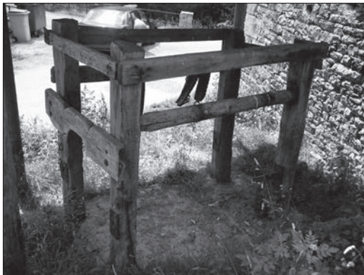
Potro de herrar ganado vacuno.

Estuvo ejerciendo el cargo hasta octubre de 1906, para reanudar la actividad en noviembre de 1907 hasta su cese por requerimiento del Gobernador Civil, el 19 de marzo de 1908, que se revocaría en abril del mismo año, hasta el nombramiento de D. Benito Echeverría, el 31 de enero de 1909.