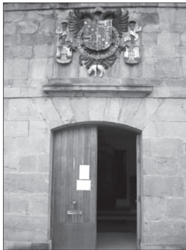
Entrada al Ayuntamiento de Gatzaga