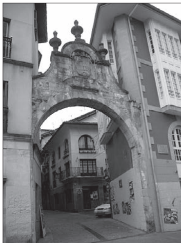
Segunda puerta medieval de Arrasate-Mondragón.