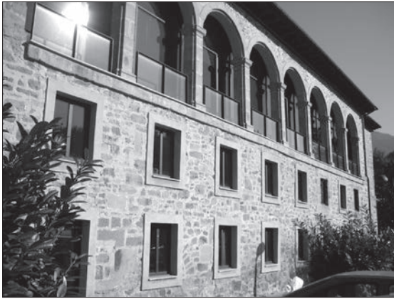
Escuela Universitaria de Magisterio en Eskoriatza.

de 25 de octubre, bajo la misma Presidencia, se reciben las normas por las que deberá regirse el concurso por parte de la Jefatura provincial de Ganadería y se corrigen los haberes que ascienden a 2.250 pesetas, recordando además, que el partido veterinario de Eskoriatza engloba a Salinas (Leintz Gatzaga).