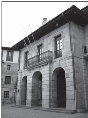
Casa Consistorial de Eskoriatza.