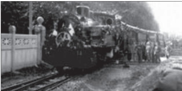
El primer tramo Vitoria - Salinas de Léniz fue abierto al público en 1889.

Durante gran parte del siglo XX, estuvo vertebrada por un ferrocarril, lamentablemente ya desaparecido, cuyo centro estaba en la ciudad de Vitoria-Gasteiz, de donde partían las dos líneas que lo integraban: Vitoria-Estella (Navarra) y Vitoria-Mekolalde (Gipuzkoa), con un ramal que llegaba hasta Oñate.