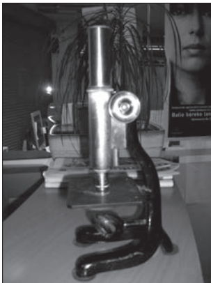
Microscopio E. Leitz Wetzlar nº 120607 de Eskoriatza.

El Ayuntamiento adquirió un microscopio para la inspección de las carnes de cerdo sacrificados en el matadero o en los domicilios, de referencias E. Leitz Wetzlar nº 120607, que en la actualidad adorna las dependencias de la Guardia Municipal de la localidad.