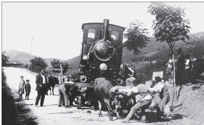
Locomotora tirada por bueyes entre Salinas y Eskoriatza.

La pérdida de importancia económica de las salinas que dejarían de ser rentables y se cerrarían, así como los daños causados por los numerosos conflictos bélicos del siglo XIX, sumirían al municipio en una profunda crisis económica y demográfica.