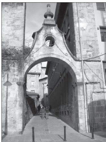
Puerta medieval en Arrasate-Mondragón.

El 27 de julio, Aldape manifestaba que no existía la incompatibilidad señalada y en la sesión del 30 se declaraba vacante la Inspección de Carnes, procediéndose a convocar la plaza por el procedimiento acostumbrado y mientras ésta se cubriera, se encargó la inspección de las carnes a un regidor municipal.