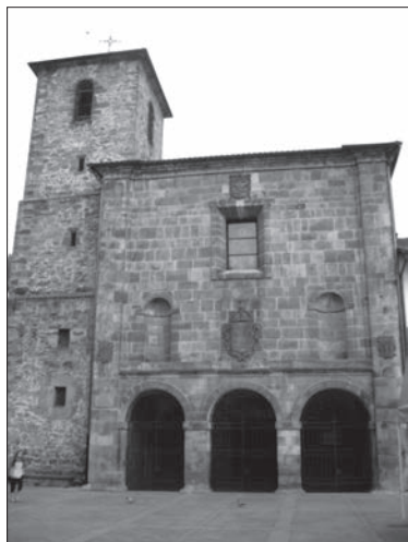
Vista del Konbentu de Arrasate-Mondragón.

Existe una leyenda que atribuye el nombre de Mondragón (derivación del original Montdragón) a la existencia antiguamente de un dragón llamado Herensuge que vivía en el monte Santa Bárbara y que aterrorizaba a los habitantes de Arrasate y de los alrededores. Este dragón fue vencido por los ferrones de la comarca y la villa que nació al abrigo del monte Santa Bárbara recibió en su recuerdo el nombre de Montdragón . Los historiadores piensan, sin embargo, que el nombre no fue originado por la leyenda sino que la leyenda fue inventada a posteriori para tratar de explicar el nombre, y creen que este evocador nombre fue sin más una ocurrencia poética del rey sabio .