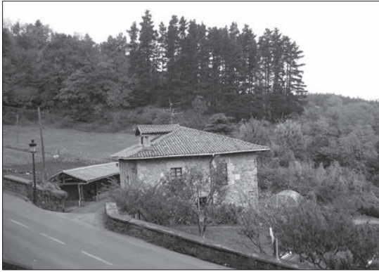
Vista desde la plaza de Gatzaga.

El casco urbano está formado por cuatro calles y una plaza que se corresponde con la antigua villa amurallada. Este casco acoge a algo más de la mitad de la población del municipio. El resto de la población vive diseminada en unos 35 caseríos por el término municipal.