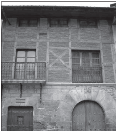
Casa en Eskoriatza.