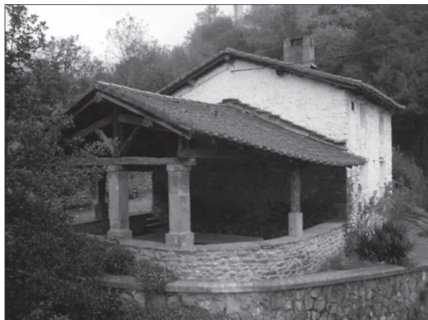
Casa lavadero de Eskoriatza. Foro C.A.