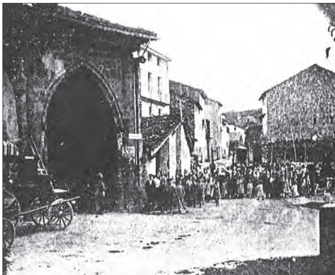
1912. Humilladeroa, Errietako errebelean