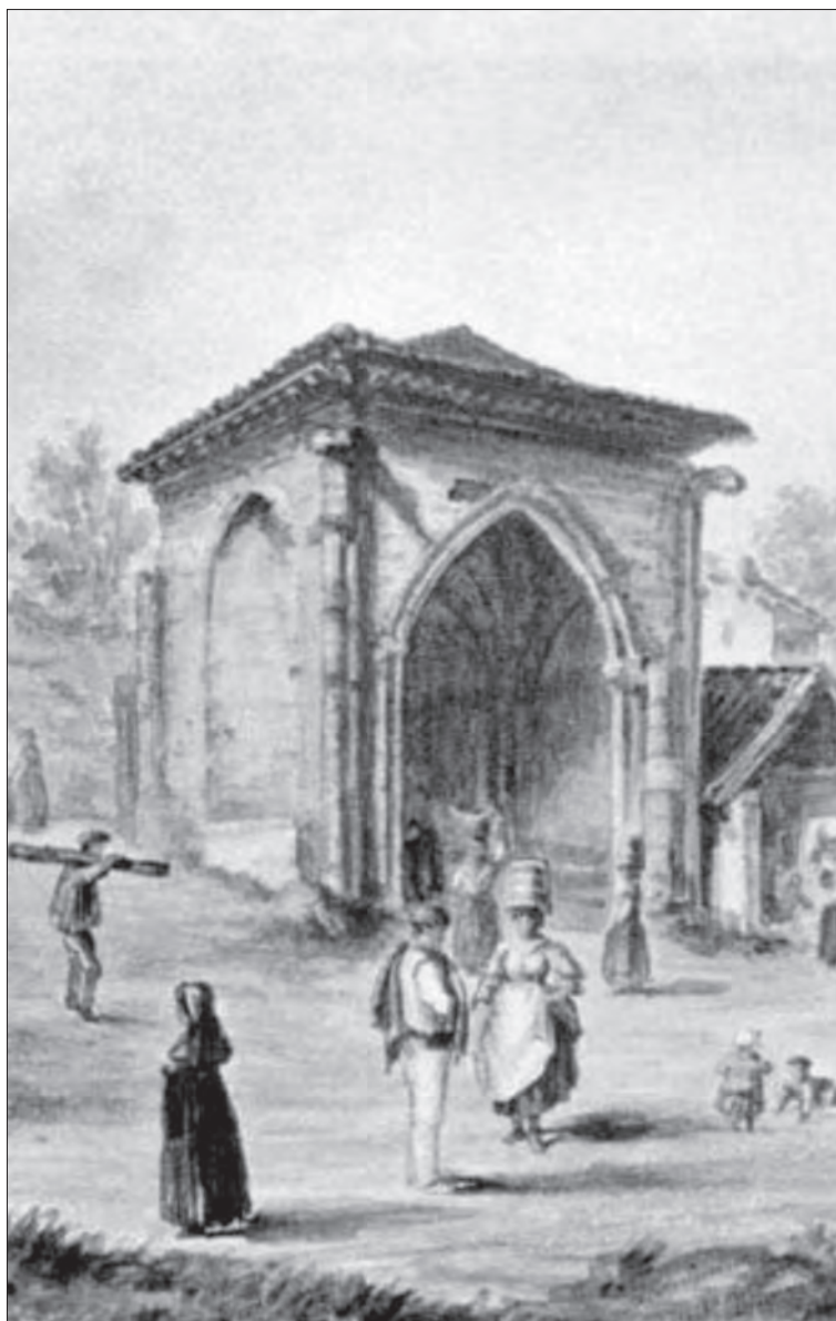
1873ko grabatua, Rodolfo Sprenger-ena