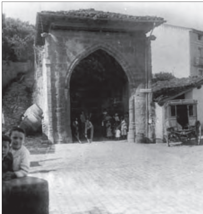
Humilladero, Lormendiko aldaparen galtzara ezkerrean

1808an Getaria Napoleonen indarrek berriro atzeman eta menperatu egin zuten. Eliza eta ermitak kuartel eta arma- eta bolbora-biltegi gisa erabili zituzten. Egoera hark bost urtez iraun zuen. 1813ko uztailearen batean frantsek alde egin zutenean, suteak, suntsiketa eta sarraskia besterik ez ziguten utzi herrian. Herritarrei beste hainbat txikizio eta hondamendi eragin ondoren, San Anton mendiko ermita eta kai zaharreko San Pedro elizei, bolbora-biltegi zirenei, su eman eta leheritu egin zituzten. Era berean, Humilladero aren ondoan zegoen Madalena eliza ere birrinduta utzi zuten, eta betiko galdu zen. Getariako herriak, ankerkeria haien ondorioz, bere edertasun, oroimen eta ondare historikoaren zati garrantzitsuak betiko galdu zituen.