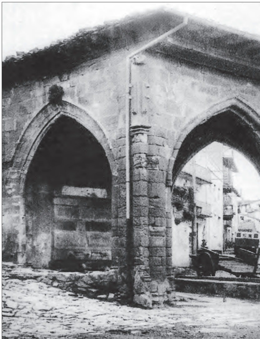
Humilladeroaren barnean atzeman daiteke “Iturri Zarra”