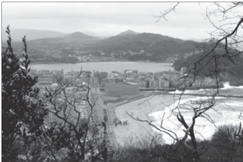
La playa de la Zurriola y las cotas de Arratzain y Mendizorrotz. (Los dos picos del fondo)

La Cruz Roja estableció diversas casas de socorro para la asistencia a los heridos: