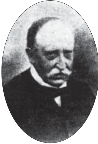
Don José Ramón de Sagastume y Larreta. (Bedaio 1817 - Donostia 1893).