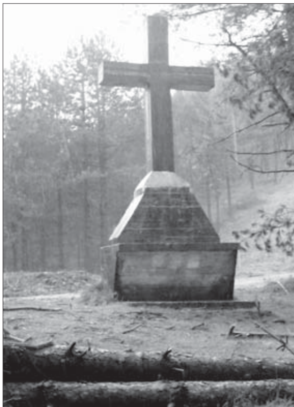
Campa y cruz de Belabieta.