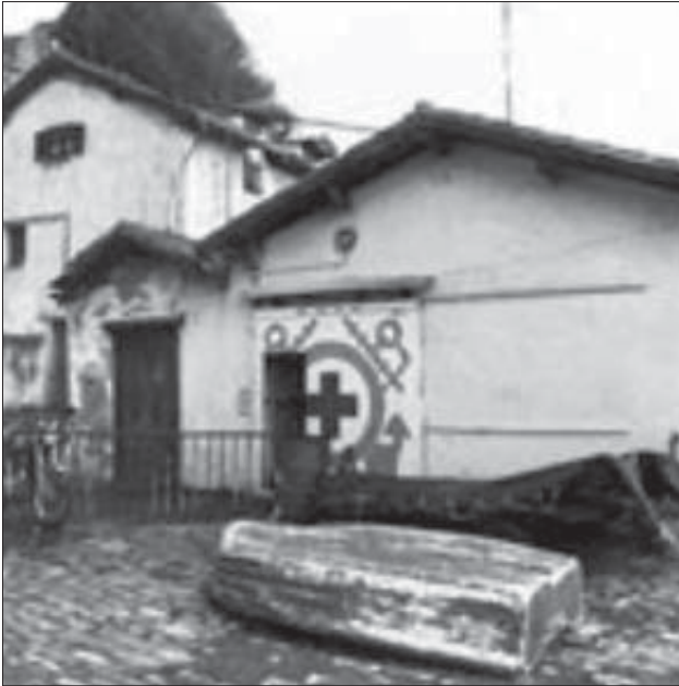
Antiguo puesto de salvamento en el puerto de San Sebastián. (“El Soto”)

La administración de los fondos de esta Asociación fue responsabilidad de la Cruz Roja de la provincia.