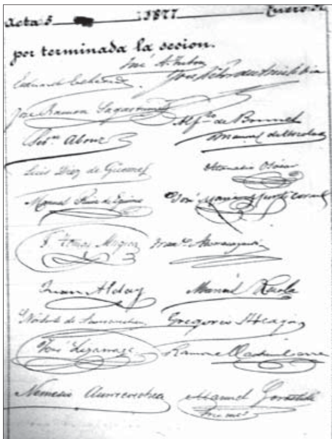
(Arch. Mpal. Sn. Sn. L-177/1877).