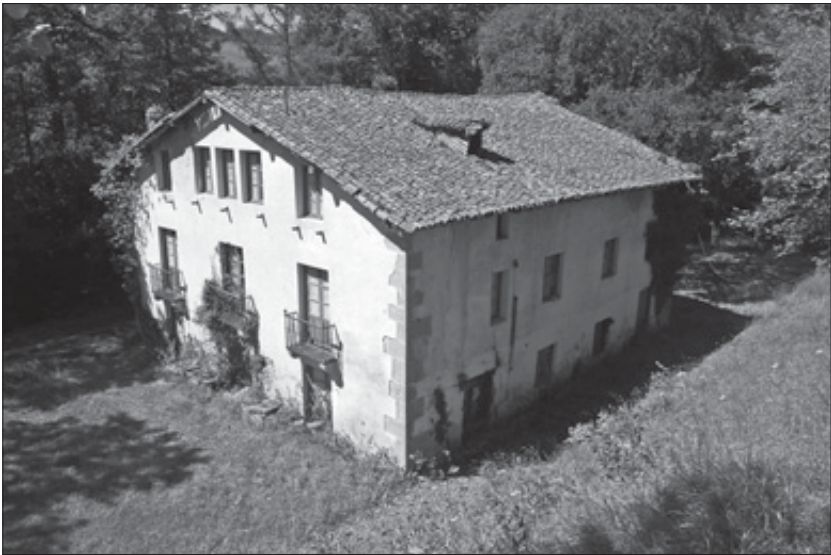
Torre de Munibe en Etxebarria (Bizkaia). Disponible en https://www.euskadi.eus/app/ondarea/patrimonio-arqueologico/torre-de-munibe/casa-torre/etxebarría/fichaconsulta/60787&origen=MSAICO&pagina=1

tipo de mobiliario y los efectos que enumeran en ellas. Las habitaciones “públicas”, donde se desarrollaría la vida común de la casa son, por un lado, una habitación principal o comedor que dispone de una mesa, sillas de junco, canapés, un reloj y una chimenea francesa, y por otro una sala abastecida con sillas, cómodas espejadas, canapés de damasco, rinconeras... y adornada con varios cuadros. Se pueden contar hasta siete cuartos dormitorio, todos ellos, salvo uno, compartidos a juzgar por la presencia de más de una caja de cama en ellos. En dichos cuartos podemos hallar las mencionadas cajas con ropa de cama, mantas, sillas, mesas y puntualmente alacenas, cuadros u objetos personales. Además de estas estancias hallamos otras destinadas a almacenamiento: es el caso del desván, en el que se guardan arcones y muebles en mal estado, el descanso, el carrojo para cocina, el denominado cuarto oscuro o la despensa, en la que destaca un molinillo de café, señal del consumo conspicuo de esta bebida. En el cuarto del horno se guardan aperos agrícolas tales como cedazos, sacos o azadas, imprescindibles en una explotación agrícola.