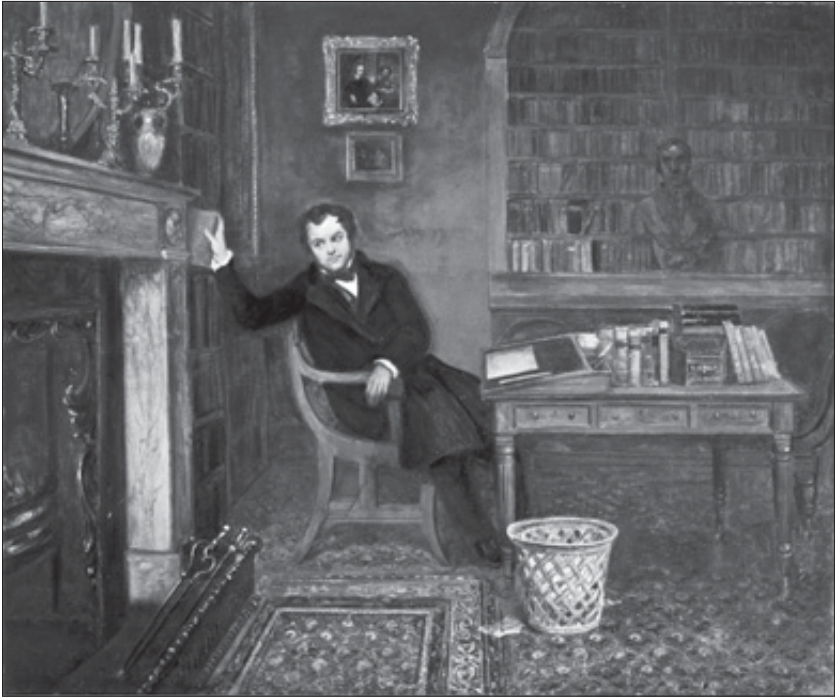
John Forster in his Library de Edward Matthew Ward (c. 1850). Este óleo nos brinda una imagen de una biblioteca privada del siglo XIX, en este caso la del biógrafo y crítico literario victoriano John Forster. Disponible en http://collections.vam.ac.uk/item/O69130/john-forster-in-his-library-oil-painting-ward-edward-matthew/

relación al total. Hemos de precisar que la unidad para el cómputo ha sido la obra, no el tomo, puesto que muchas obras compuestas por varios tomos. Somos conscientes de la dificultad que supone asignar una obra a una determinada temática, debido a que ello implica catalogar el contenido de los libros de acuerdo con nuestras propias categorías intelectuales. Por ejemplo, las fronteras entre la teología o la filosofía podrían no estar definidas de manera nítida en obras anteriores al siglo XVIII, o el contenido de los libros que hemos considerado prácticos puede asimilarse sin problemas al de otros sobre materias “técnicas” o “científicas”. A pesar de estas limitaciones, hemos decidido asumir los riesgos.