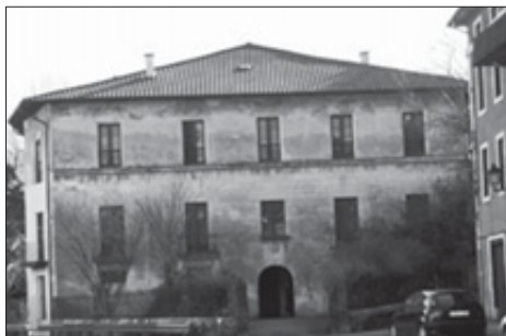
Torre Bidarte, en Markina.