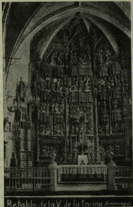
Retablo de la V. de la Encina Alberiego

Hemos de lamentar que haya desaparecido el Archivo del Santuario, por lo que de sus orígenes no nos queda más que la tradición que hasta nosotros ha llegado, pero existe un testimonio monumental que es el que compone el conjunto actual de la Encina, desde su imagen románica del siglo XI hasta las últimas obras rea-