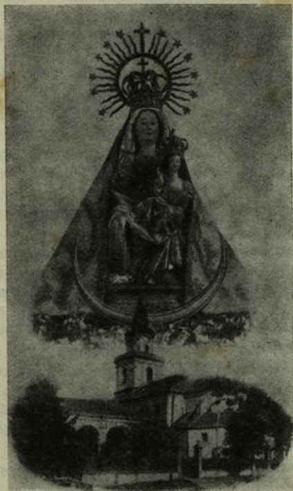
Imagen del siglo XIV. recientemente coronada y perspectiva del Santuario.

Esta merced fué confirmada por Juan I y Enrique III y los Ayala continuaron siendo Señores de Arceniega y del valle ayalés hasta que, en 1817, los vecinos de estos lugares se emanciparon del entonces Conde de Ayala que lo era el Duque de Veragua, Berwick y