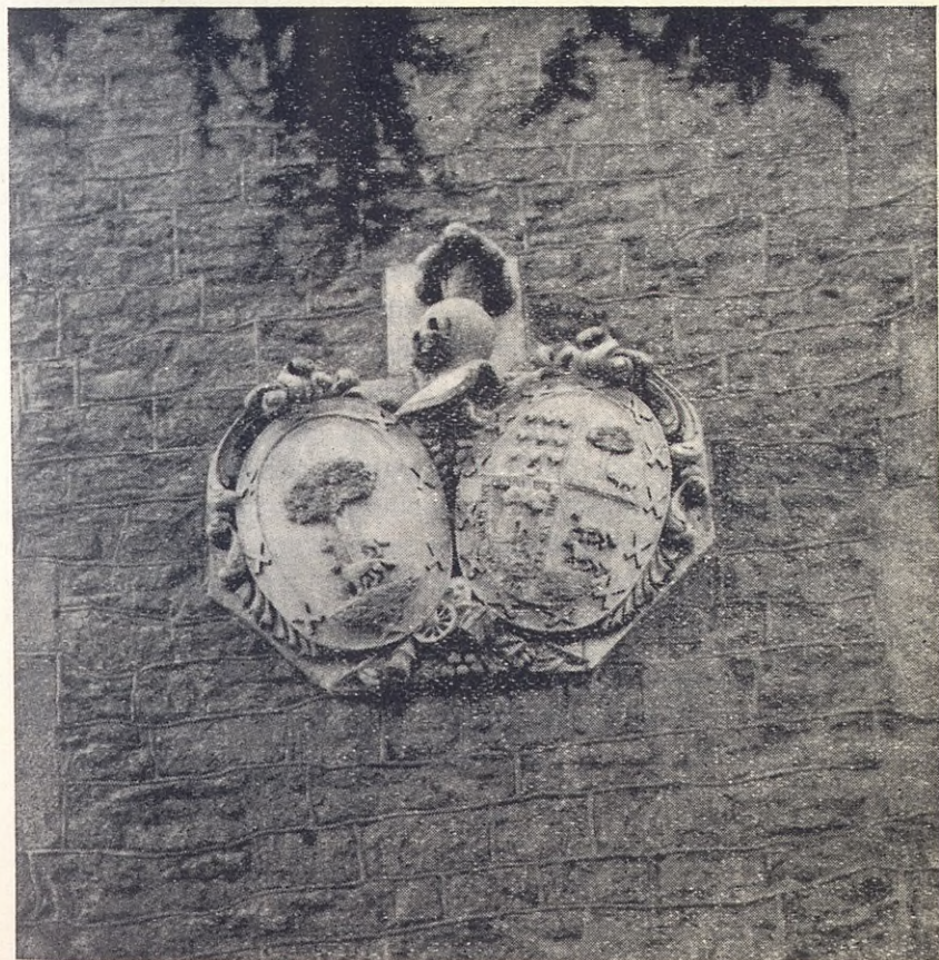
Escudos unidos de UNCETA y MURUA en Vergara.