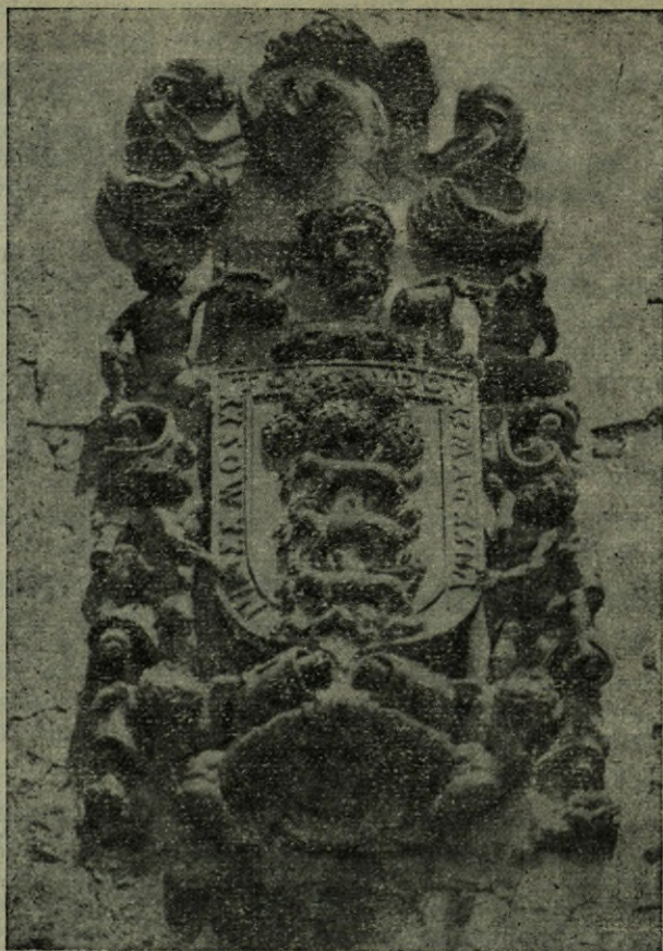
Escudo de Unzueta, que ostenta el palacio del mismo nombre.

A los dos años, de nuevo fue sitiada la casa de Unzueta, y a consecuencia de ello, volvieron a entablar un duro combate en el monte Akondia; refiere el folio 85, del libro XXII, del mencionado códice: