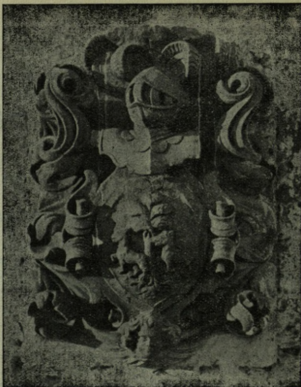
Escudo Unceta del caserío del mismo nombre.

En el manuscrito original se puede apreciar claramente que el nombre "Celinos de Unzueta" no fue escrito por la misma mano. Dicho sujeto debe ser el que Carmelo Echegaray cita como beneficiador de la colegiata de Cenarruza, en la Geografía General del País Vasco-Navarro , tomo Vizcaya, página 865: "...el siglo XII se cuenta de un don Celinos, pariente de los reyes de Navarra, que vino a desposarse con una hija del solar de Unzueta de Eibar, y que quiso hacer ofrenda a la iglesia de Cenarruza de veinticuatro vacas preñadas para ensalzarla y honrarla."