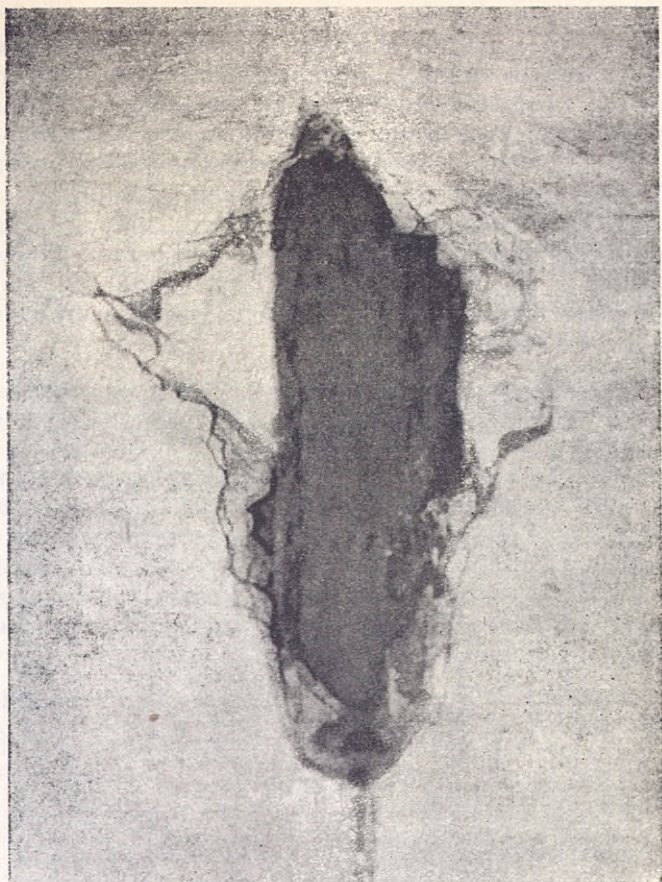
Foto n.º 1.—He aquí la pared de donde se arrancó el Crucifijo de Acitain.

de unos ocho centímetros; 75 cm. de altura y 45 cm. de envergadura de brazos.