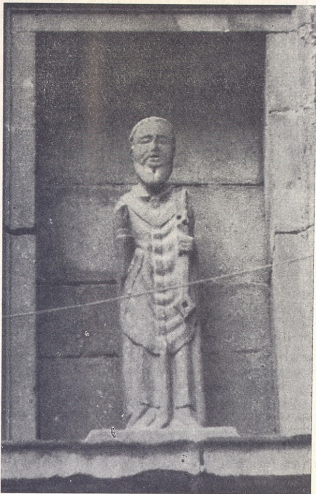
La imagen románica de San Pedro, en la hornacina de la fachada oriental de la parroquia San Andrés Apóstol de Eibar