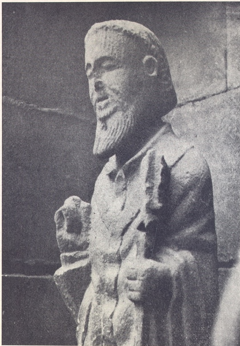
El San Pedro románico de Elbar