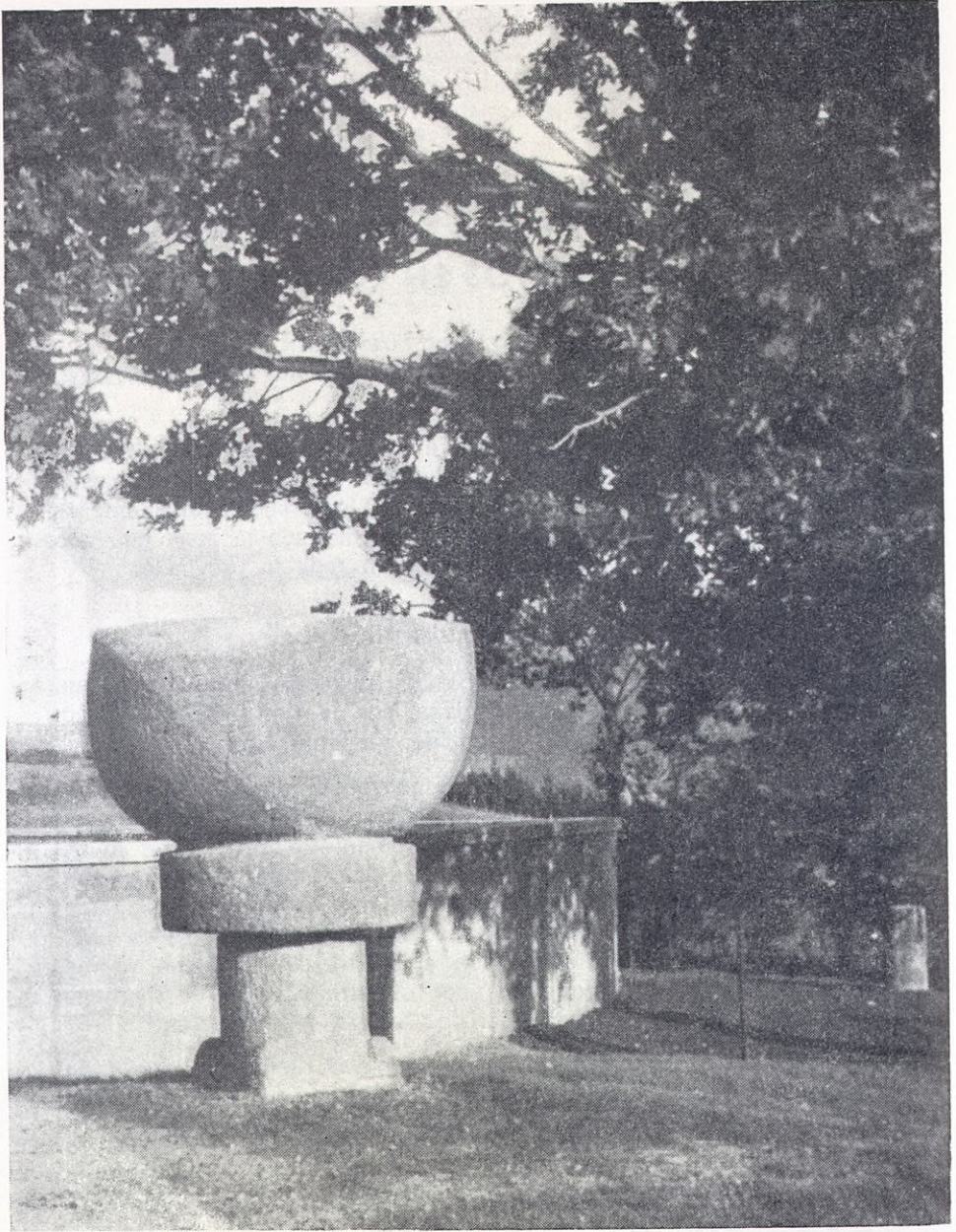
Pila románica de Apózaga.