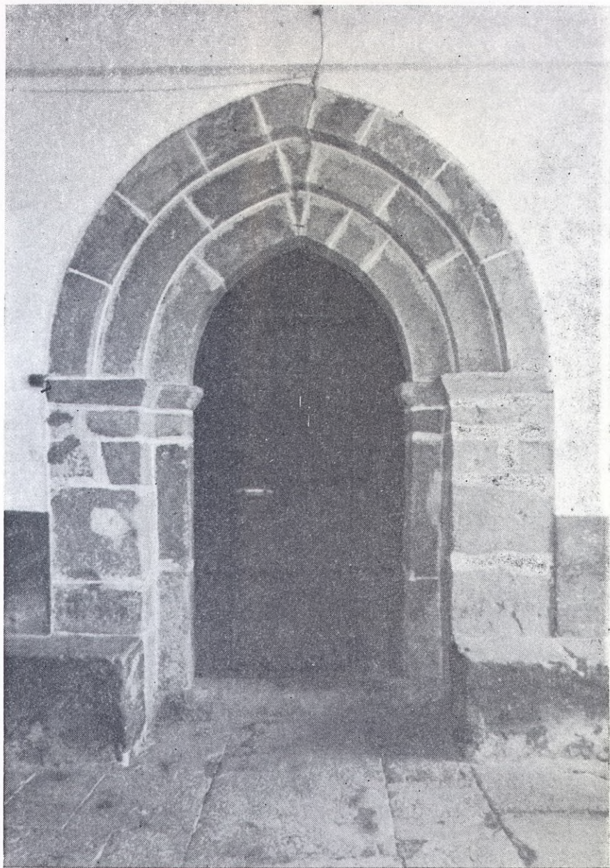
Portada románica de Guellano.