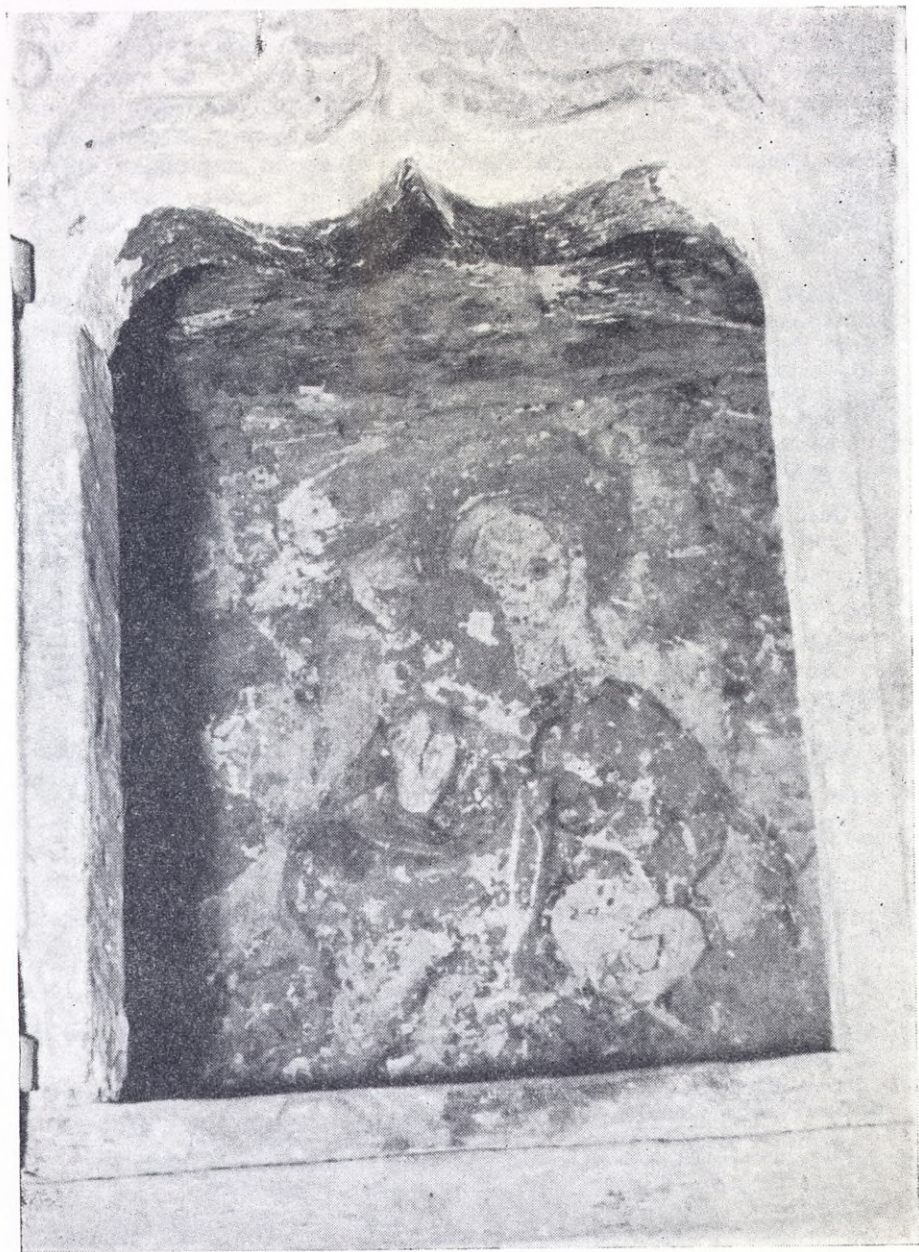
Virgen de Mendiola (Foto L. P. Peña Santiago).