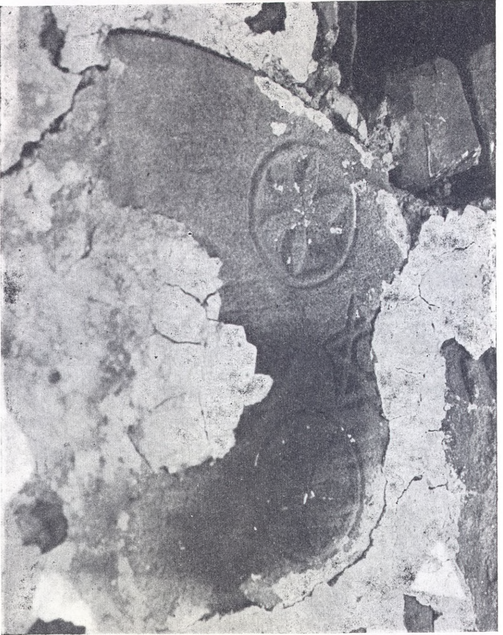
Ventanal de Zarimutz (Foto L. P. Peña Santiago).