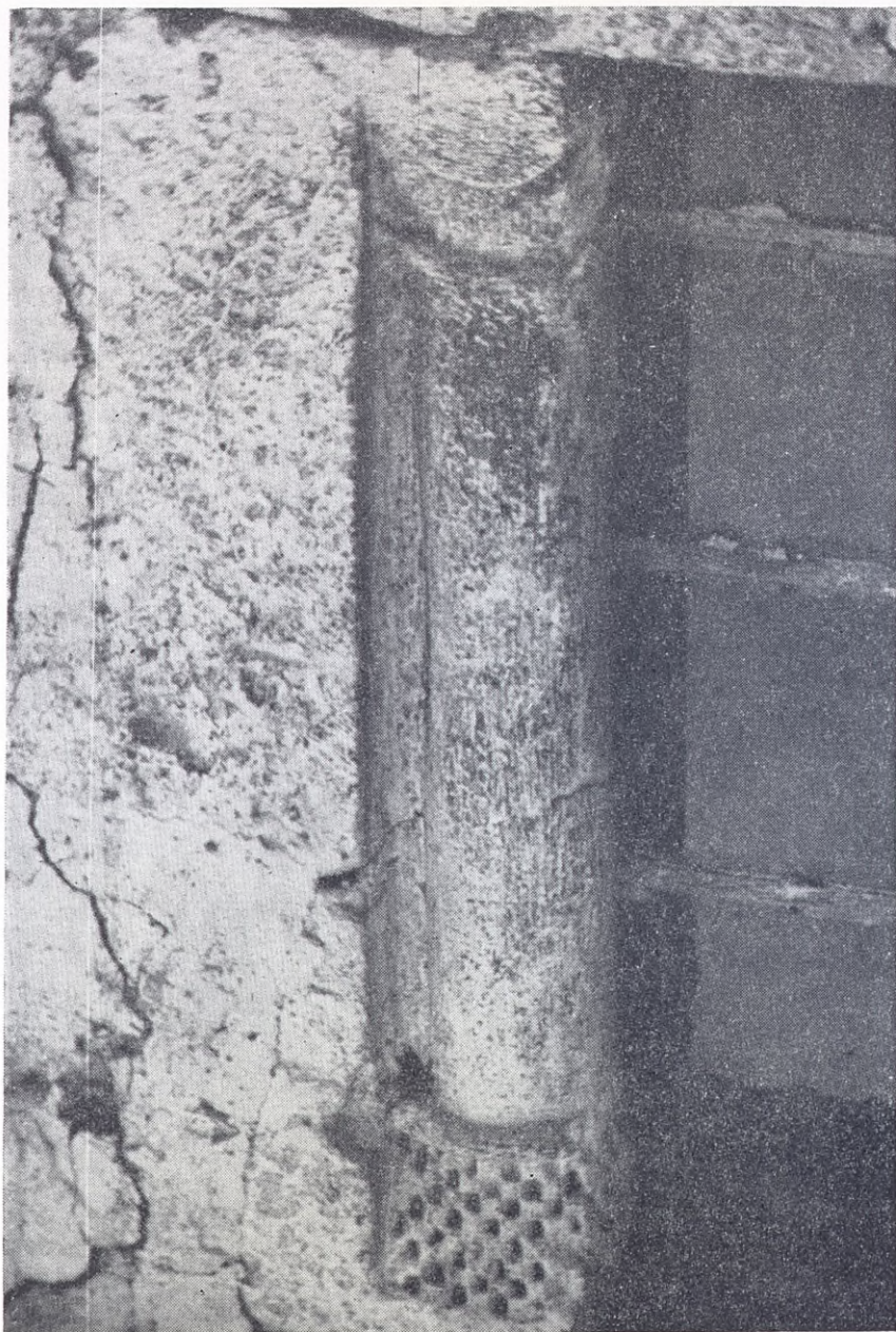
Ventanal de Izurieta (Foto L. P. Peña Santiago).