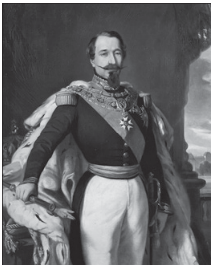
Fig. 2. General Leopoldo O’Donnell (1809-1867).

Tras el convulso periodo de regencias, salvados los episodios revolucionarios continentales de 1848, y tras pasado el bienio progresista (1854-1856), el país vuelve a manos de los liberales moderados, cuyo espadón es Ramón