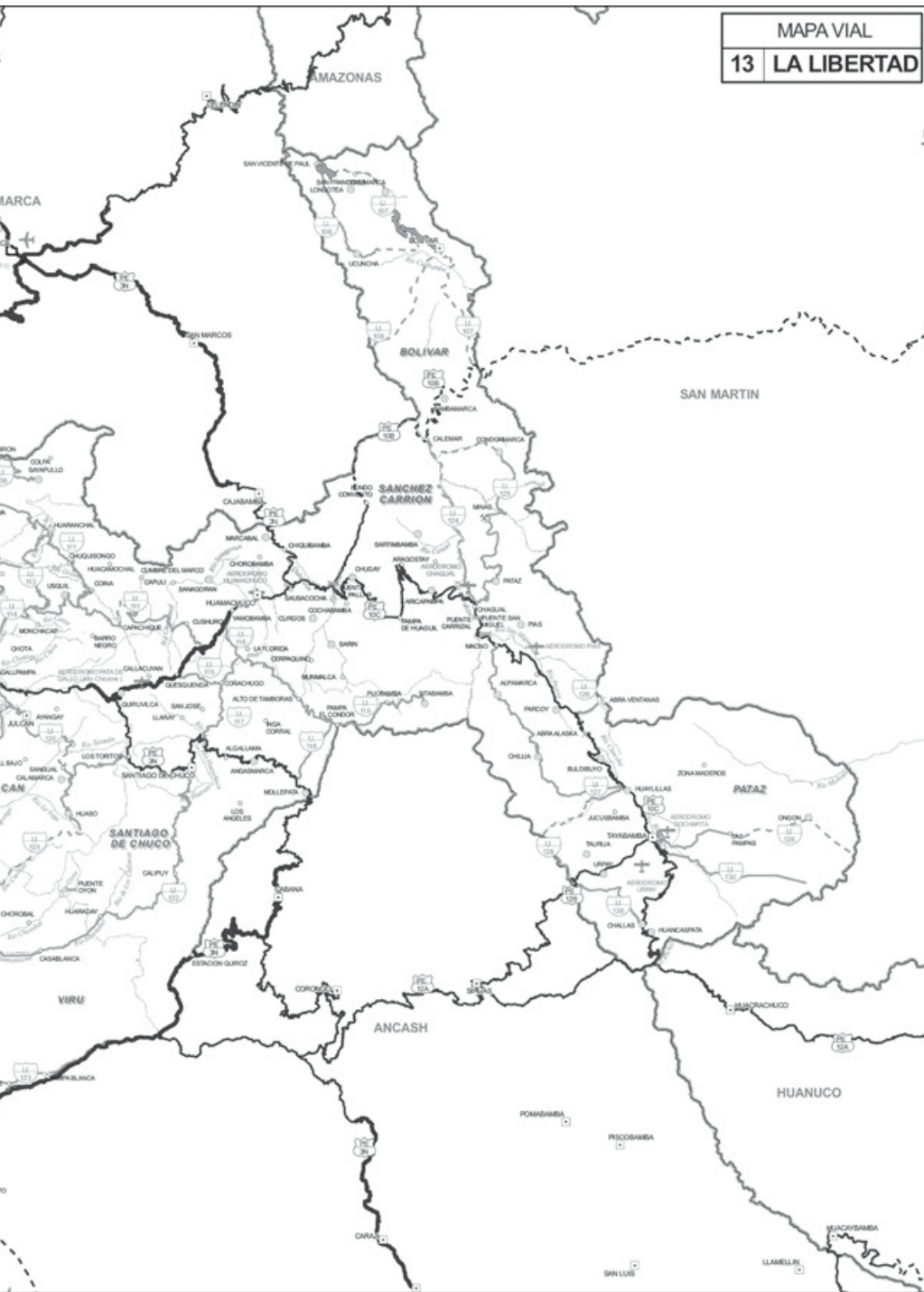
Fig. 5. Mapa del departamento La Libertad.