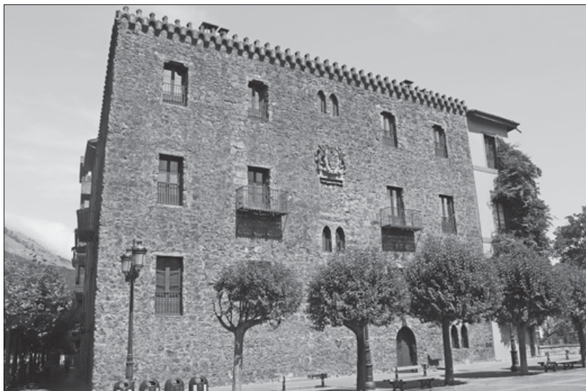
Lámina 4. Fachada situada hacia la plaza.