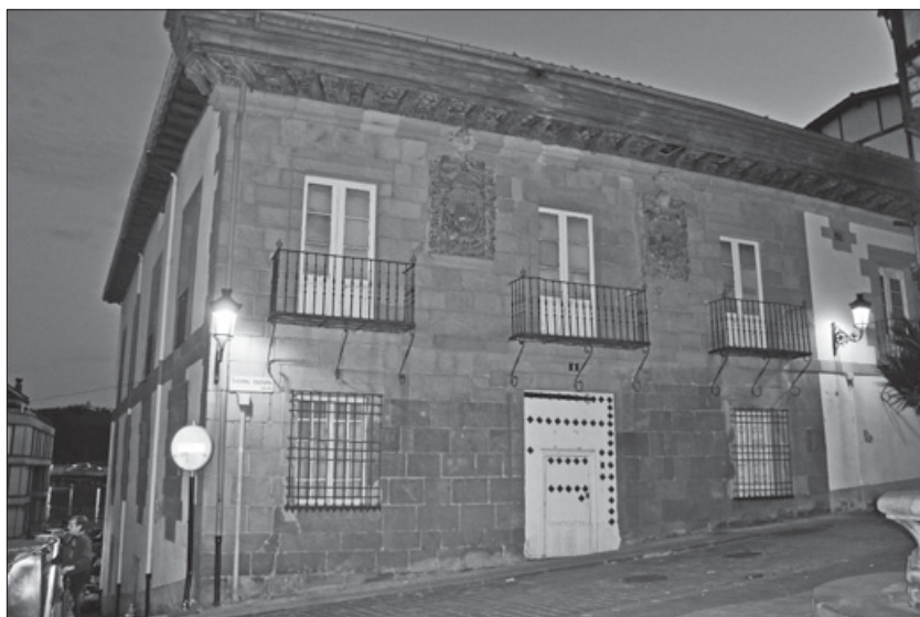
Lámina 18. Fachada del palacio Olazabal.

En una pequeña plaza del casco de la villa de Zumaia se asienta la casa Olazabal: claro ejemplo de arquitectura civil propia del siglo XVII.