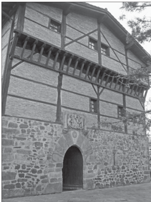
Lámina 3. Fachada actual de la casa-torre Legazpi.

Es un edificio de planta rectangular y con tejado a dos aguas. En la parte sur, a modo de entrada, el edificio cuenta con una puerta apuntada y dove-lada, encima de la que se sitúa el escudo de la familia Arriaran 193 . El piso