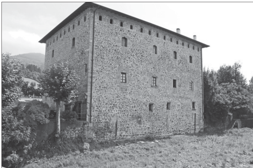
Lámina 10. Vista general del Palacio Isasaga.