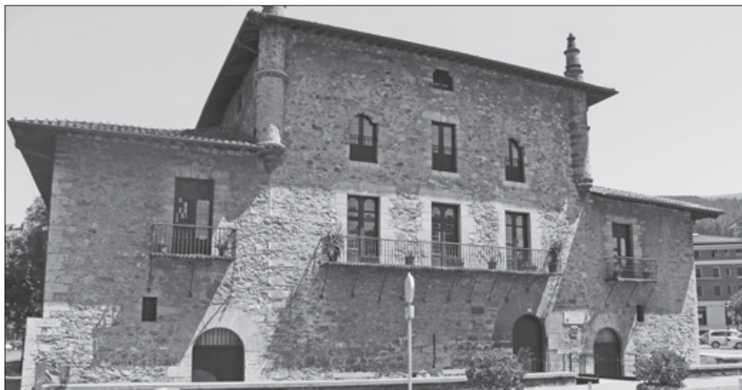
Lámina 7. Fachada principal del Palacio Emparan.

Este palacio estaba situado fuera de la villa de Azpeitia, dentro de su término municipal junto al río Urola, al viejo puente y el antiguo molino de emparan 230 : en una situación totalmente estratégica.