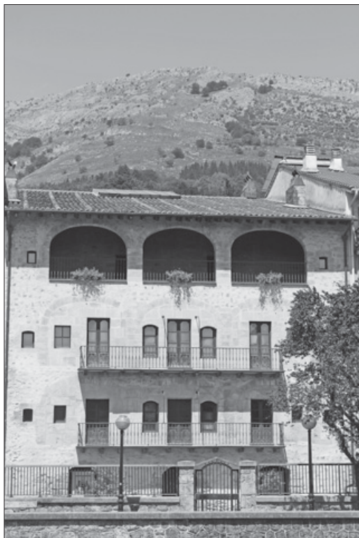
Lámina 13. Fachada trasera del palacio Basozabal.

A comienzos de 1980, una vez que la casa fue expropiada por el Ministerio de Educación y Ciencia, realizaron obras de consolidación por parte del arquitecto mencionado 335 . Así, entre otras actuaciones, recalzaron los cimientos, demolieron los dos pisos de madera, reconstruyeron los muros, así como las mochetas de piedra y el apoyo de los aleros. Por último, en 1985 se ejecutó un proyecto adicional a la restauración 336 en la que se desmontó parte del entramado, reconstruyendo y sustituyendo piezas; se repararon los muros que forman el núcleo central del edificio y la pavimentación del patio central.