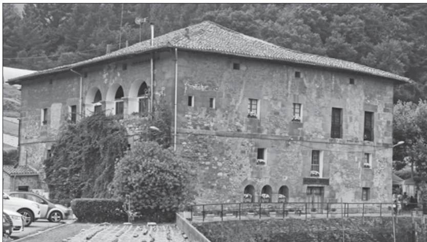
Lámina 6. Vista de la Casa Bedua.

El linaje de Bedua disfrutaba del privilegio de cobro de los derechos reales sobre el comercio y la extracción del hierro desde finales de la Edad Media. Por ello, era el lugar principal para tomar los caminos del valle, que alcanzaban tanto los pueblos como las ferrerías del interior. De esta manera, se descargaba el mineral que llegaba de Bizkaia, desde las minas de Somorrostro y se almacenaban los productos con los que comercializaban los ferrones. En resumen, desde el siglo XIV se tienen noticias de la existencia de este pequeño puerto fluvial. En muchos documentos se denominaba al Urola 222 con el nombre de río de Bedua 223 , lo que explica la importancia de este núcleo económico. Asimismo, se le daba el nombre de su origen o río de Legazpia .