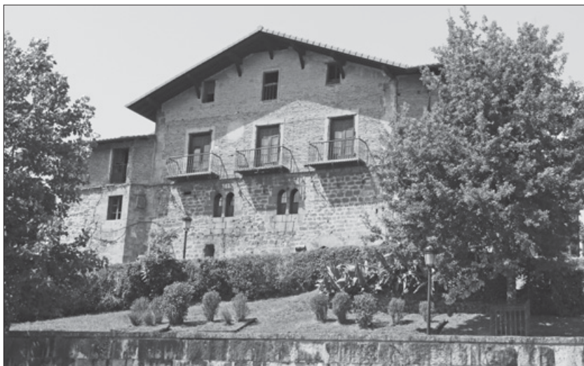
Lámina 2. Fachada de la Casa-torre de Balda.

La antigua vivienda del linaje de los Balda se asienta en la ladera que desciende del monte Izarraitz, entre el actual cementerio y la propia villa de Azkoitia; esto es, en una colina enfrente de San Martín de Iraurgi, donde se situó la originaria aldea.