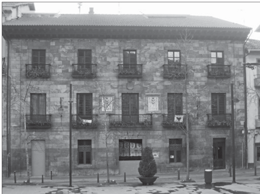
Lámina 16. Fachada principal del palacio Corral-Ipeñarrieta.