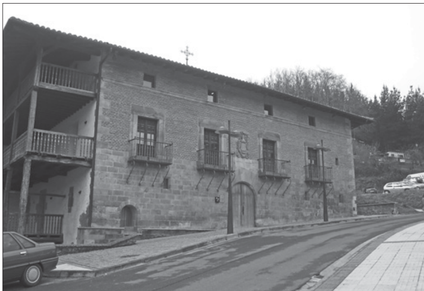
Lámina 11. Fachada principal del Palacio Bikuña.

Ciertamente, en el año 1384 se menciona a Pedro de Bikuña por lo que dicho dato, y la afirmación de que la familia ha estado desde tiempo inmemorial poblando las tierras de Legazpi, lleva a suponer que eran propietarios del solar dónde se edificó el palacio. En este sentido, se ha de evidenciar que hacia finales del siglo XIV pudo existir una edificación. Por ello, coincido con la publicación que asegura que en el palacio se observan restos de lo que pudo ser la antigua residencia de la estirpe 311 . En consecuencia, vistas las fechas expuestas, no es difícil deducir que el solar albergó una torre medieval. Claro