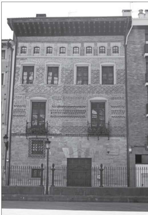
Lámina 12. Fachada principal de la casa Anchieta.