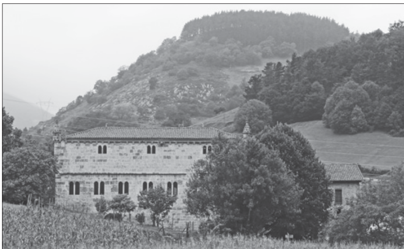
Lámina 8. Vista general del Palacio Lili.