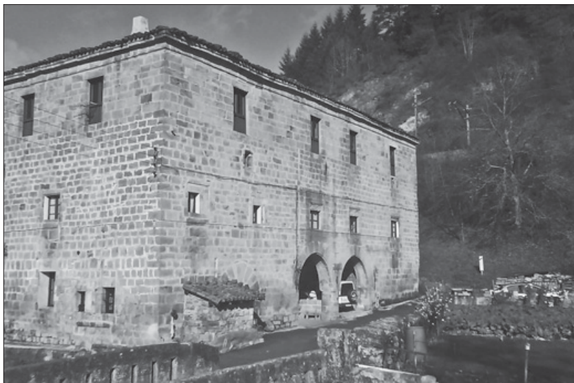
Lámina 5. Fachada principal del Palacio Elorregui.