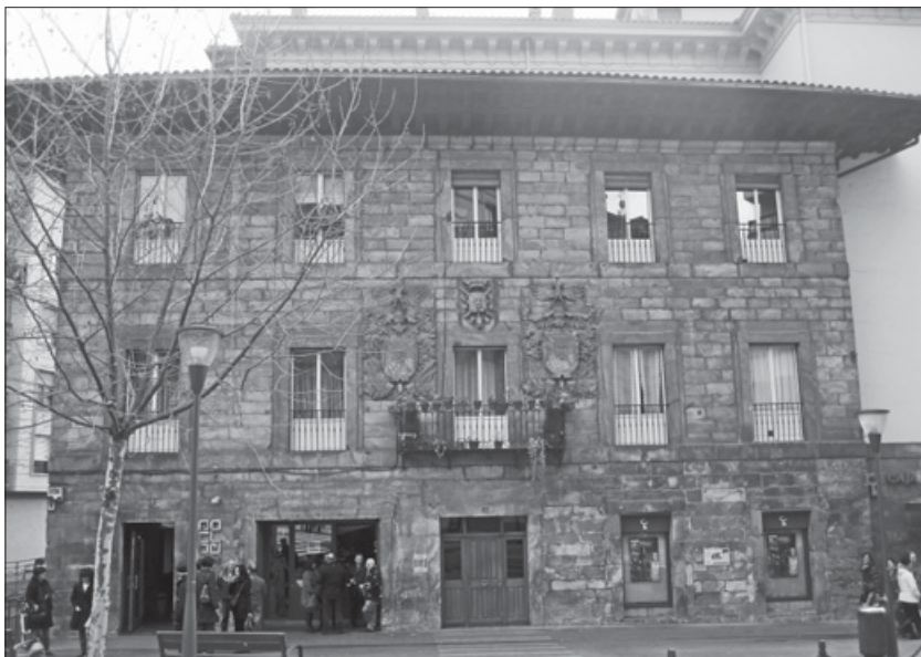
Lámina 17. Fachada del Palacio Areizaga.

de sillería y de planta rectangular, siendo los elementos más destacables de su fachada los tres escudos, única ornamentación que presenta junto con el alero de madera tallado. Los escudos 380 , de mayor tamaño, los sujetan dos águilas con sus garras. Por otro lado, fue la vivienda de la familia hasta que en la Guerra de Independencia los franceses la utilizaron como cuartel 381 , momento en el que el palacio sufrió varios daños 382 . Después, como la mayoría de