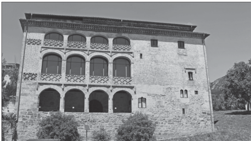
Lámina 9. Fachada principal del Palacio Floreaga.

Es una construcción palaciega de carácter rural que estaba emplazada fuera de las murallas de Azkoitia, detrás de la iglesia parroquial; antiguamente estaba rodeada de viñas y huertos con caserías que dependían de ella.