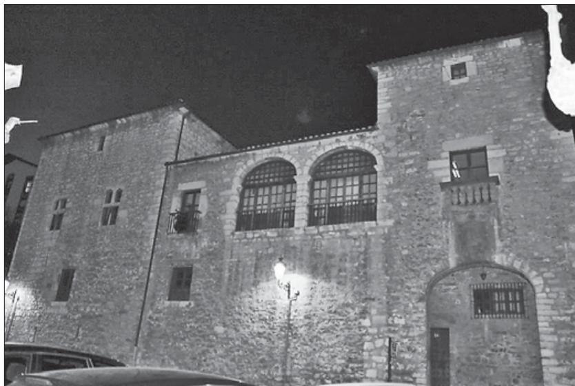
Lámina 14. Fachada principal del palacio Ubillos.

El edificio es un claro ejemplo de la evolución que algunas torres vivieron para convertirse en palacios en consonancia con los nuevos gustos, las que no fueron derruidas por orden de Enrique IV.