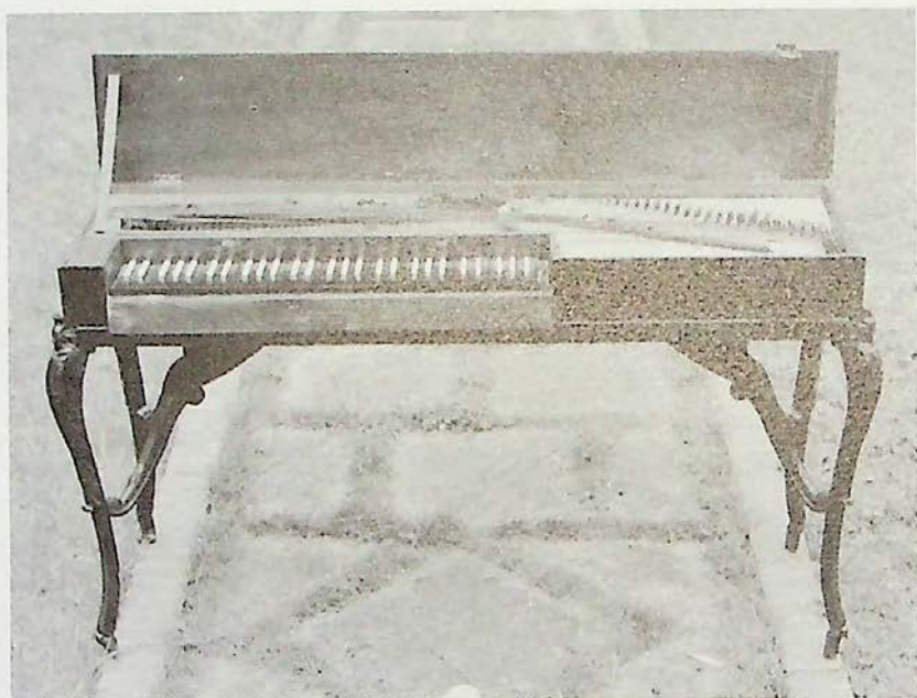
Clavicordio existente actualmente en el Palacio de Insausti de Azcoitia.