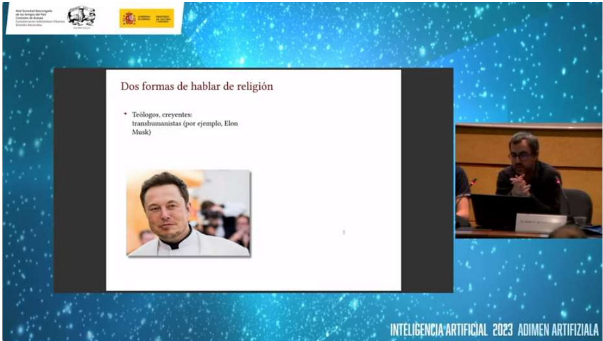
Mesa 3 (2 de noviembre de 2023)