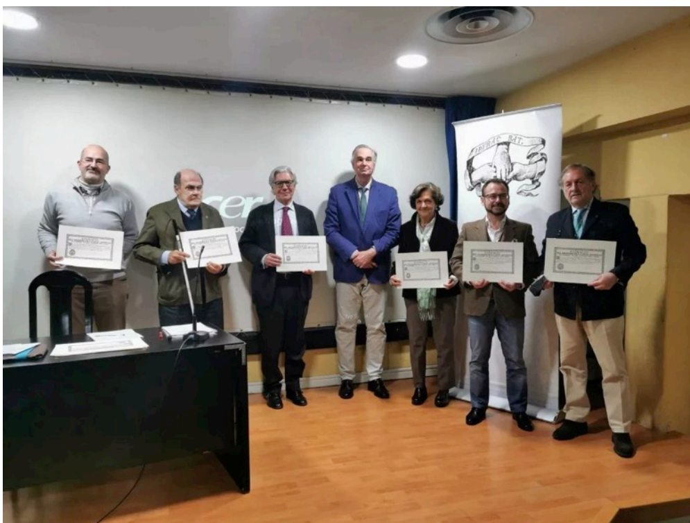
Entrega de diplomas a los nuevos socios