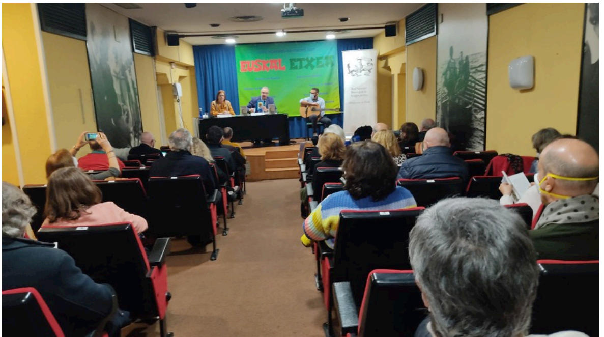
Aspecto general de la Sala Pello Aramburu de Euskal Etxea