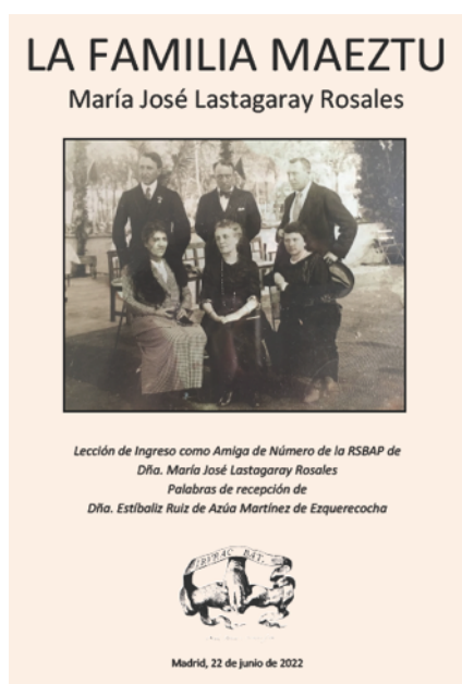
Portada de la Lección de Ingreso