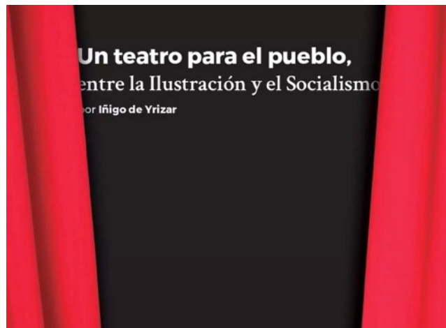
Portada de la obra