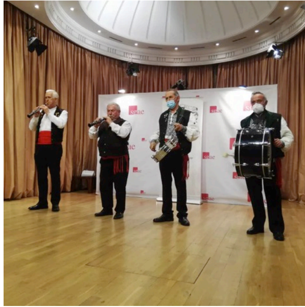
Músicos segovianos que amenizaron la velada