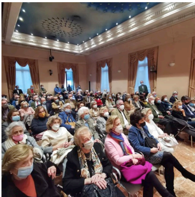
Aspecto general del Salón Manuel de Falla

El Homenaje tuvo lugar en el salón Manuel de Falla de la Sociedad General de Autores y Editores (SGAE) el 28 de febrero a las 18,30 h. y fue muy concurrido