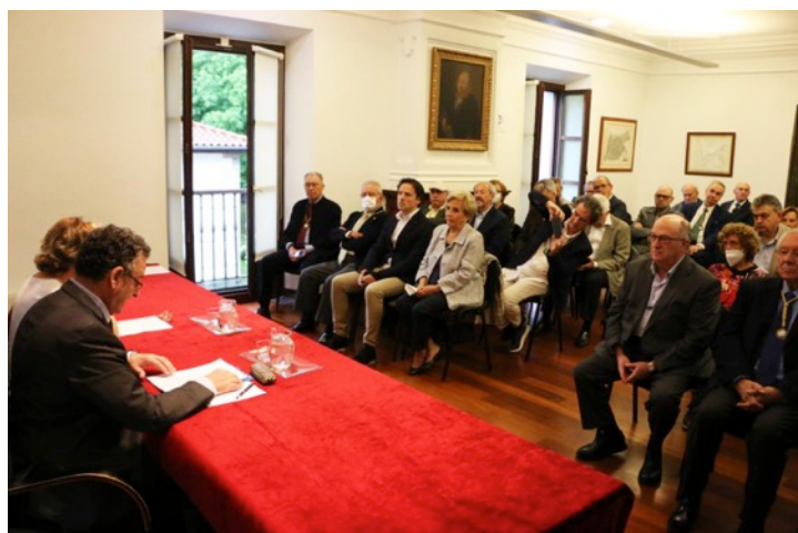
Aspecto general del Salón del Palacio de Intzausti