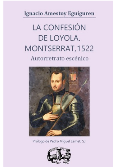
Portada de la obra