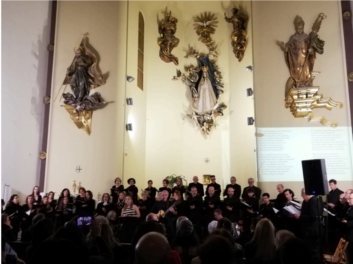
Aspecto General de la iglesia con los intérpretes y el coro de Euskal Etxea