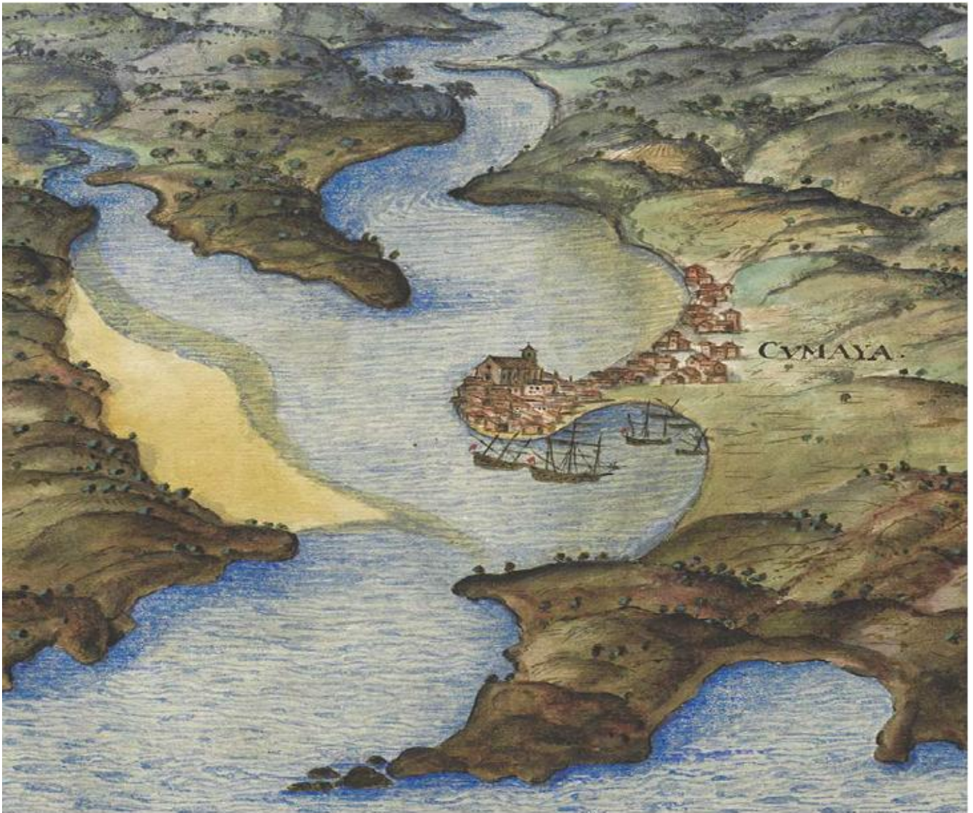
Vista de Zumaia y su puerto. Siglo XVII. Zumaia eta bere portuko ikuspegia. XVII. mendea. Autor/Egilea: Pedro Texeira. 1634. «Descripción de España y de las Costas y Puertos de sus Reynos». (Austrian National Library).