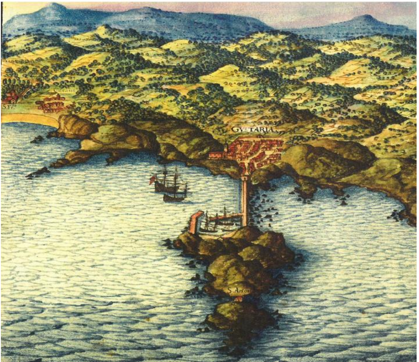
Panorámica general de Getaria y alrededores. Getaria eta ingurueta ikuspegi orokorra. Autor/Egilea: Pedro Texeira. 1634. «Descripción de España y de las Costas y Puertos de sus Reynos»..