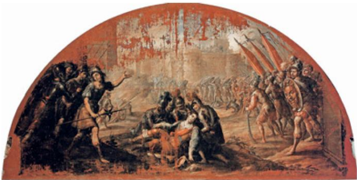
Fig. 6. San Ignacio, herido en las murallas de Pamplona, por Cristóbal Villalpando (1710) Museo Nacional del Virreinato, Tepotzotlán.