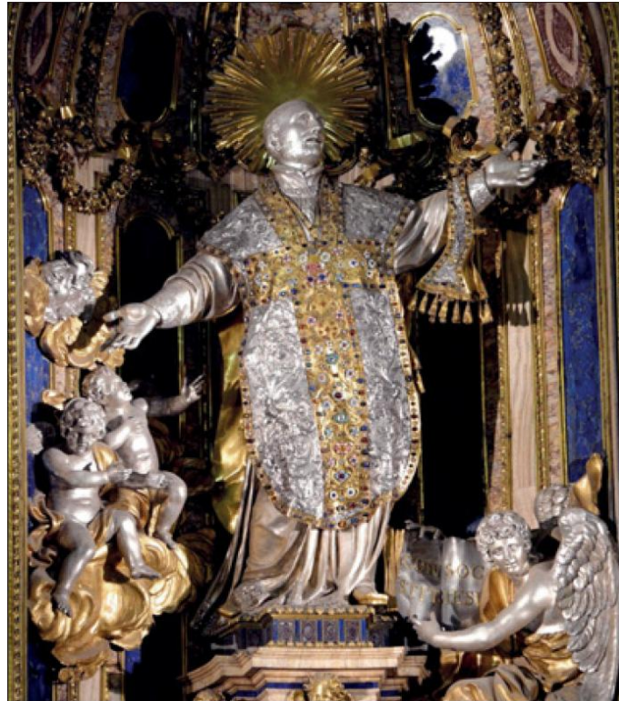
Imagen de San Ignacio en el Jesú de Roma