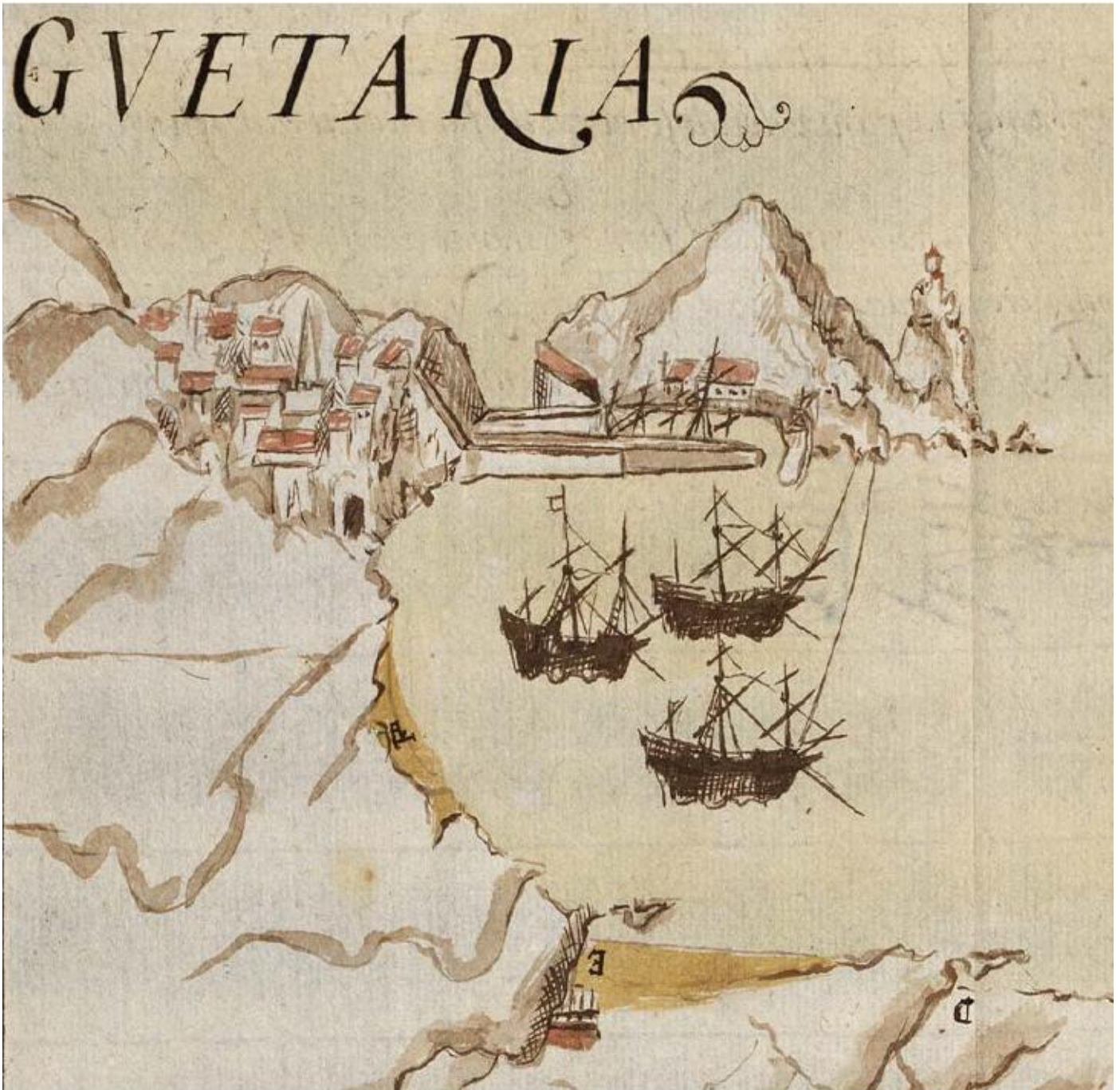
Retrospectiva del siglo XVII de la villa de Getaria. Getariako XVII. mendeko irudikapena.