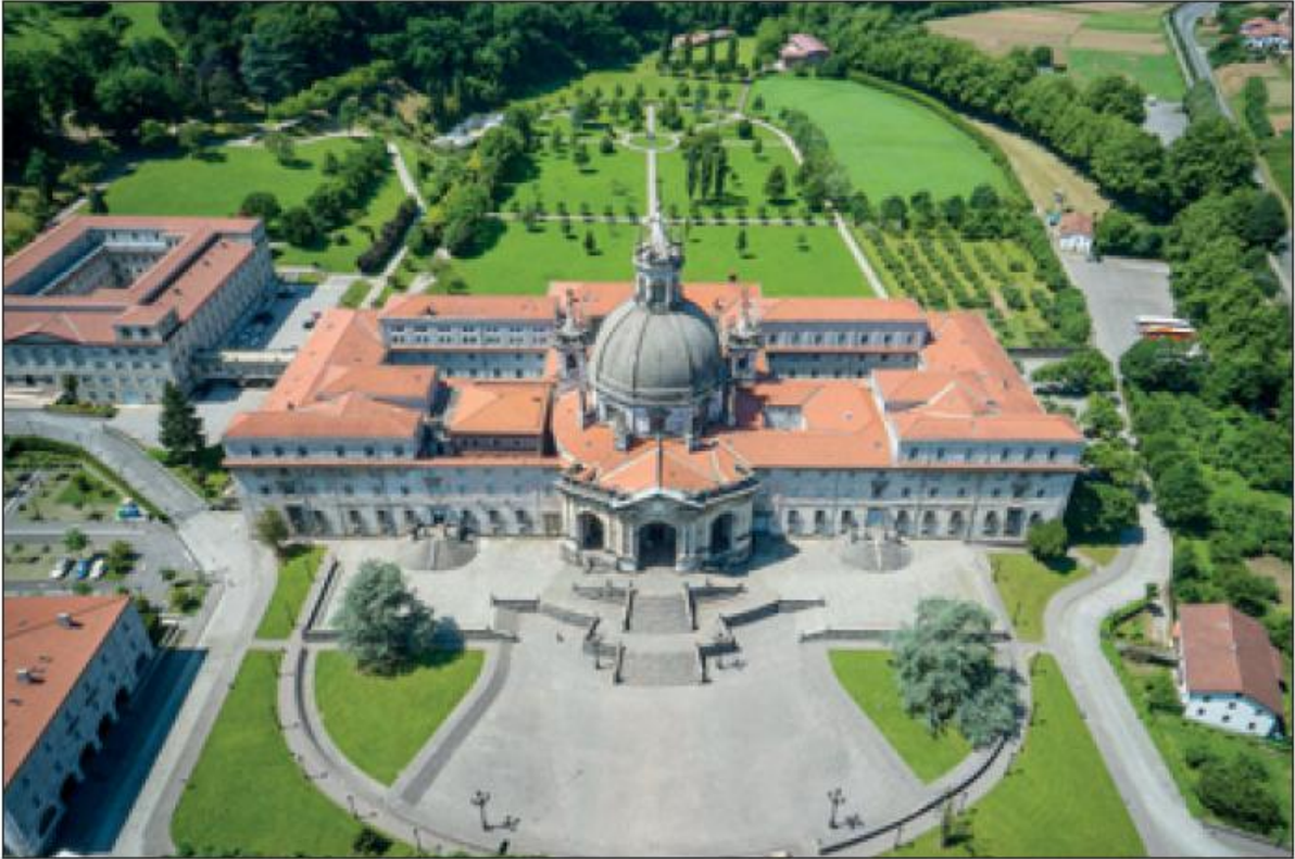
Fig. 1. El Santuario de Loyola, a vista de pájaro, que aquí habrá que decir a vista del Espíritu Santo . A la izquierda de la cúpula, el tejado cuadrado de la Casa-Torre Natal.