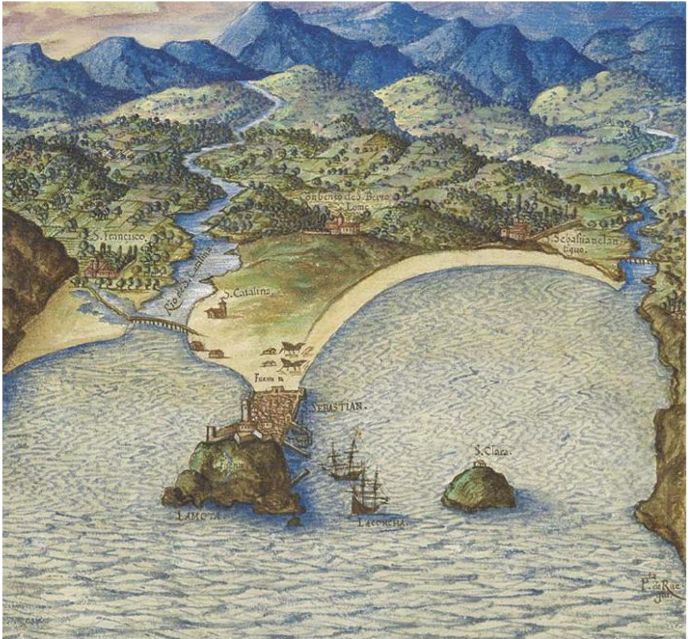
Antigua perspectiva de San Sebastián desde la mar. Donostiako antzinako ikuspegi itsasotik. Autor/Egilea: Pedro Texeira. 1634. «Descripción de España y de las Costas y Puertos de sus Reynos»..