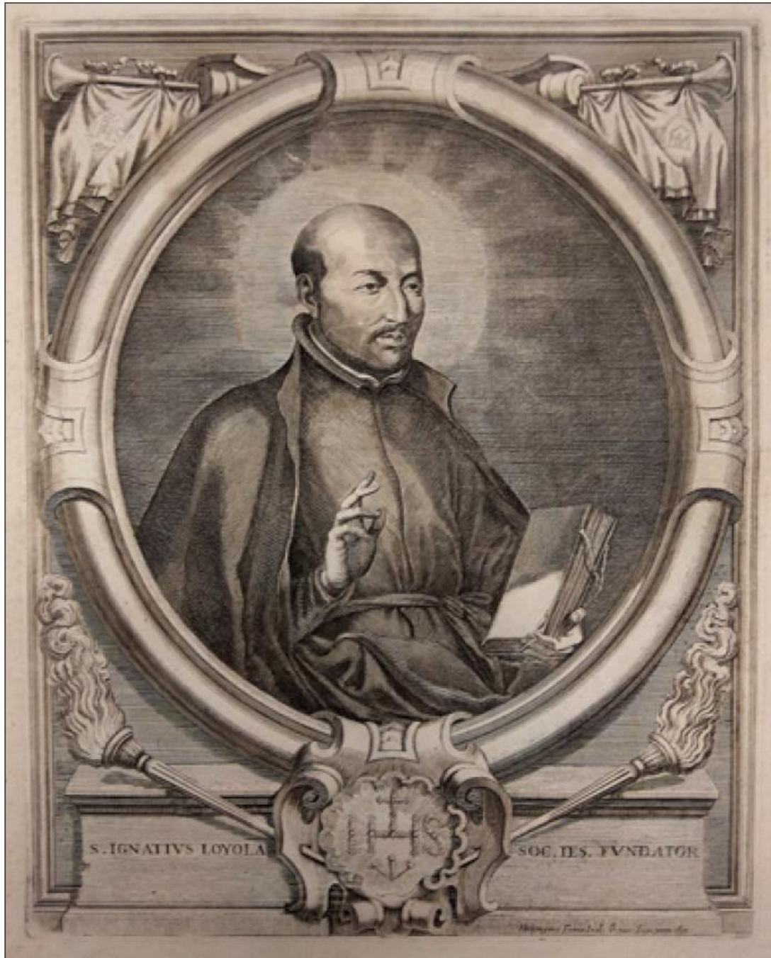
S. IGNATIVVS LOYOLA – SOC. IES. FVNDATOR Hieronymus Frezza Scul: Romae Sup. Perm. 1692.