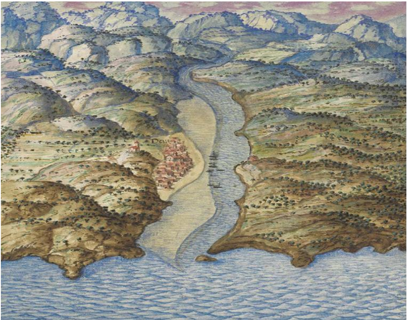
Perspectiva antigua de la villa de Deba y su entorno. Deba hiribilduko eta bere inguruko antzinako ikuspegia. Autor/Egilea: Pedro Texeira. 1634. «Descripción de España y de las Costas y Puertos de sus Reynos». (Austrian National Library).