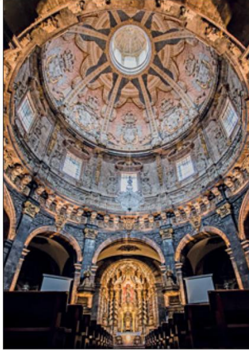
Fig. 28. Loyola, Interior de la basilica, con los mármoles policromos y su cúpula de 21 metros de diámetro interior, decorada con escudos tallados y pintados.